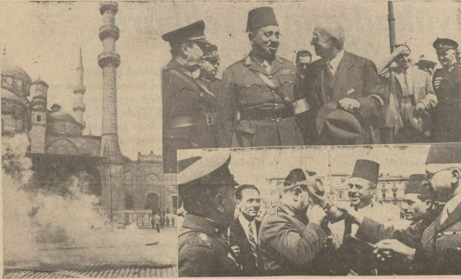
Solda: Eminönüne düşen mefruz bomba, sağda yukarıda: Başvekil Mısır askerî heyeti reisi ile görüyor, aşağıda: Mısır askerî heyeti azası maske takıyorlar

Bir taraftan yaralılar tedavi edilirken, diğer taraftan gazlı saha kireçlenmiş, arozözlerle yakanmıştır. Maskelerini takmış ve kauçuk elbiselerini giymiş itfaiye memurları ile temizlik amelesinin muntazam çalışmaları, Mısır askerî heyeti ile askerî hakemlerin takdirlerini mucip ol-