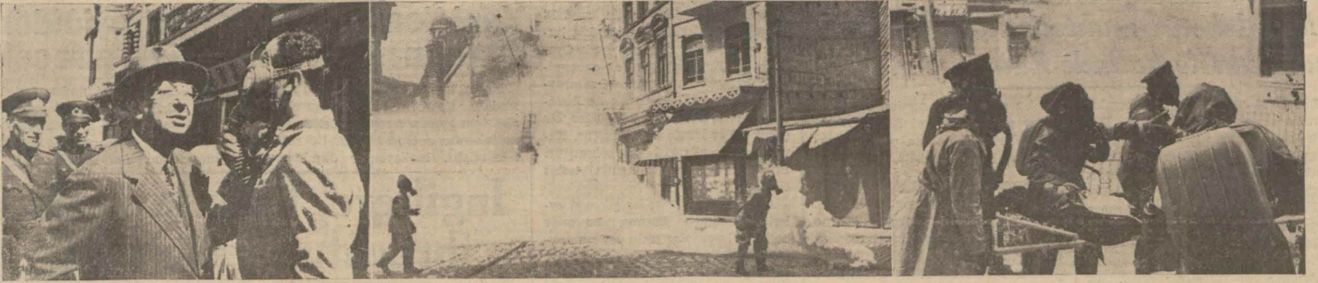
Dünkü hava hücumu tecrübesinden bir kaç intiba: Solda: Başvekil, maske takmış bir memur ile görüşüyor, ortada: Bahçeye düşen mefruz bir gaz bombası, Sağda: Mefruz bir yaralı sedye ile kaldırılıyor