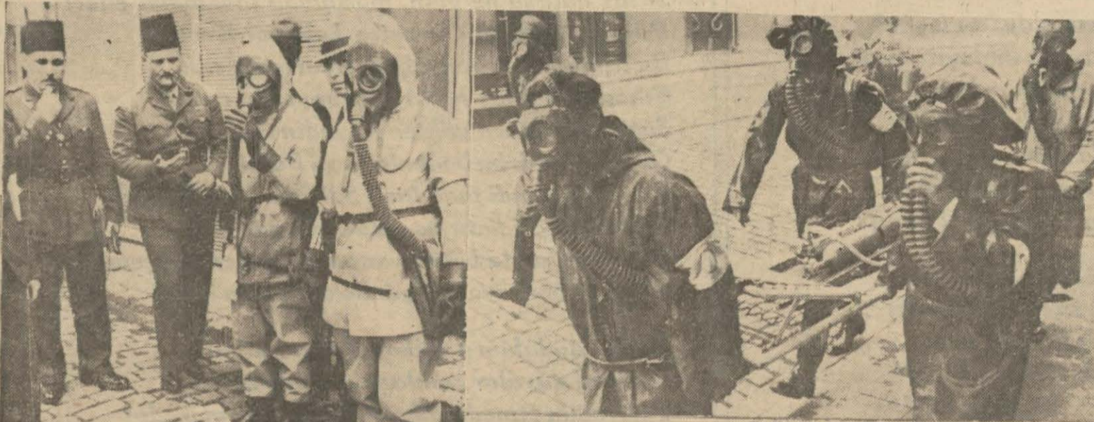
Solda: Mefruz bir yaralı sedyede, sağda: Zehirlenenlere müvellidülhumuza veren âlet naklediliyor, aşağıda: Mefruz bombanın infilâkı