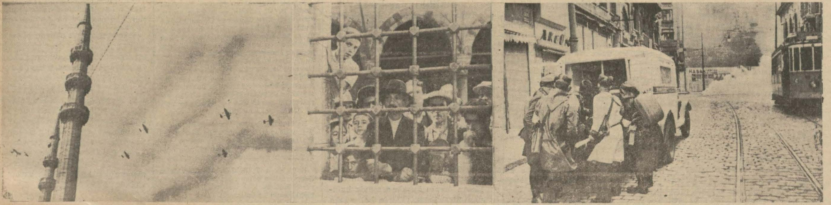
Solda: Mefruz düşman tayyareleri İstanbul semalarında, ortada camilere sığınan halk, sağda: Bir yaralı cankurtaran otomobile konuluyor