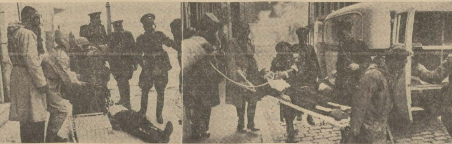
Hava hücumunda mefruz ilk yaralı tedavi ve naklediliyor