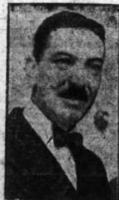
JUAN VICENTE GÓMEZ

Las cancillerías de Venezuela y Colombia se comunican. A propósito del aniversario de la muerte del Libertador, se cruzaron trascendentes despachos sobre la paz de América y el conflicto colombiano.