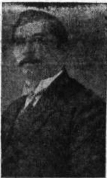
GRAL. JUAN VICENTE GÓMEZ

La manifestación de cordialidad del pueblo venezolano se origina en el hecho que hace pocos días se inauguró en Bogotá la avenida Caracas, nombre este dado a una de las más hermosas calles de Bogotá y