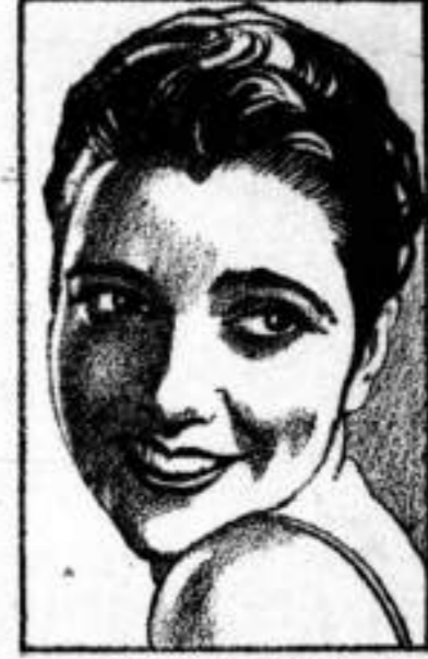
KAY FRANCIS En Paramount Pictures

DOMINGO EN NOCTURNA La empresa presenta el enorme drama parlante de la CASA PARAMOUNT