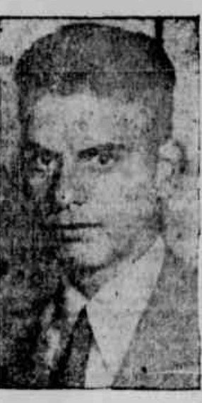
SOBRE GESTO DE UM JOVEM