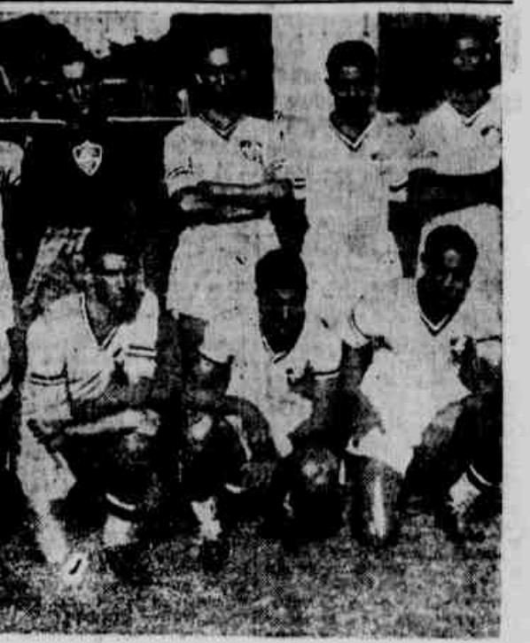
O "onze" tricolor que venceu o Vasco

NOTA: O Pery venceu o Vasco tem, o Fluminense é um sério concorrente para conquistar mais uma vez o sceptro do "soccer" carioca.