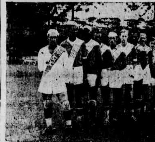
O ESQUADRAO DO PERY QUE DERROTOU O CAXIAS

goleiro Lauro entra na jogada, rebatendo o curo para a frente. Bodinho, unico goal Controlam os peryenses e vão ao ataque. Bôde de posse do bôlão corre pela sua ala e serve muito bem a Bôde e este sem perda de tempo chuta violentamente ao gramado e logo é reiniciado o grande match, por intermédio do Caxias. Abreu prejudicou os seus Os visitantes reanimados, organizam logo no inicio do segundo tempo perigosa investida por in-