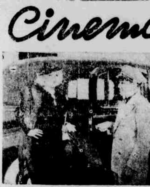
MAE WEST, junto ao seu carro.

RIO — Especial. A desigualdade na arrecadação do imposto sobre a Renda, em favor do Estado de São Paulo, vem sendo apontada como uma das causas da crise do algodão brasileiro.