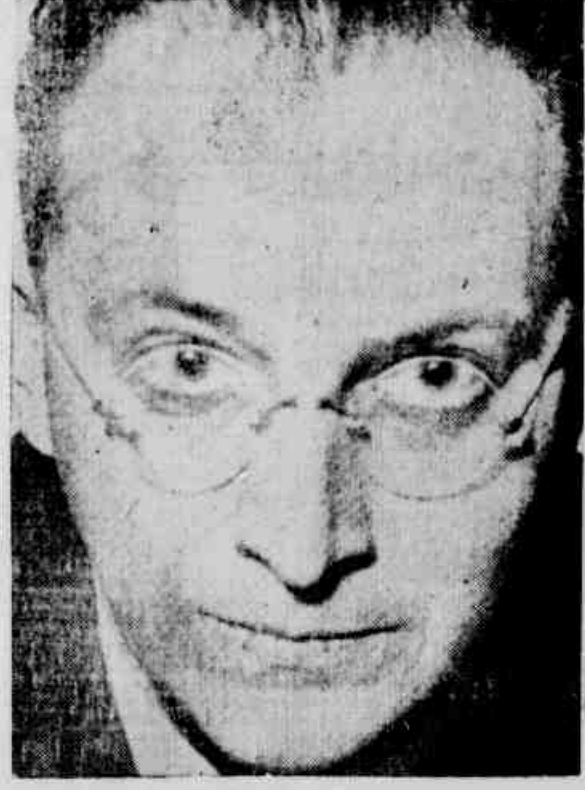
SR. KONRAD HENLEIN

PRAGA, 24 — O dirigente sudeta Konrad Henlein pronunciou um discurso em que declarou: "A reivindicação colonial allemã forma parte integrante dos nossos interesses imprescindiveis. Cada allemão deve combater pela reivindicação e a paridade dos direitos colonias".