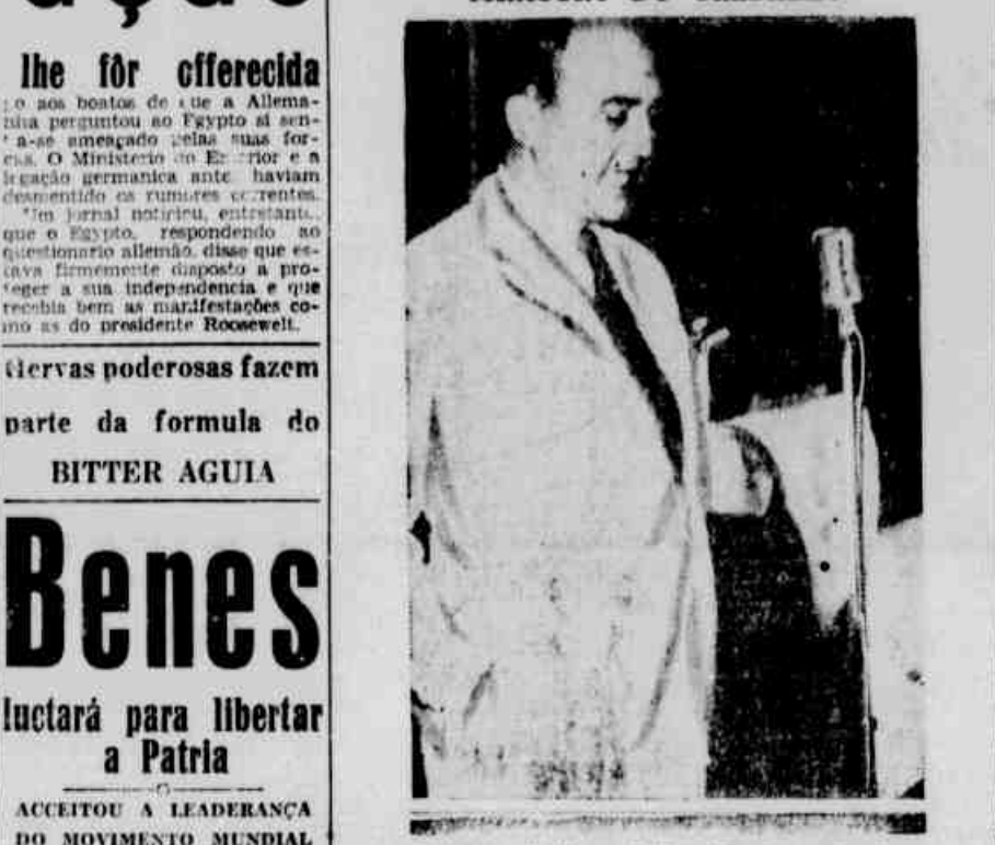
O Ministro Waldemar Falcao, falando ao microphono

Importante portaria baixada pelo MINISTRO DO TRABALHO