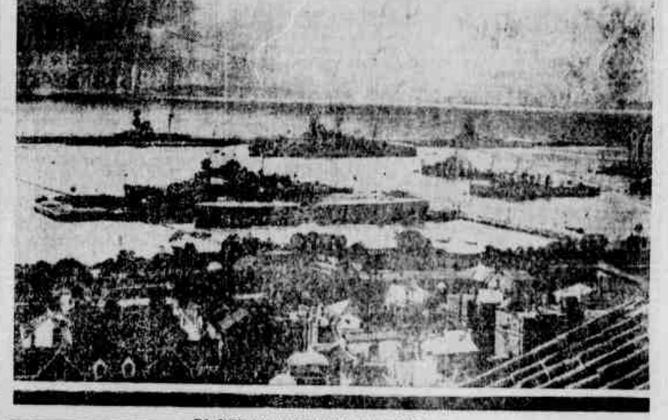
PARTE DA ESQUADRA BRITANNICA

PARTEM PARA O MEDITERRANEO ORIENTAL TRINTA VASOS DE GUERRA BRITANNICOS — SUPPÕE-SE QUE O EGYPTO ESTEJA AMEAÇADO DE AGRESSÃO