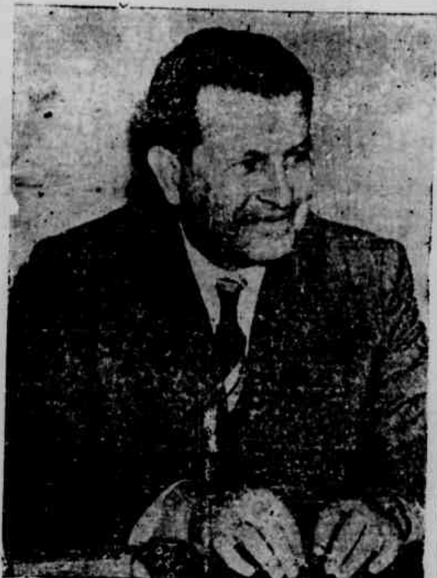
A missão do governo é assegurar um clima de garantias para todos.