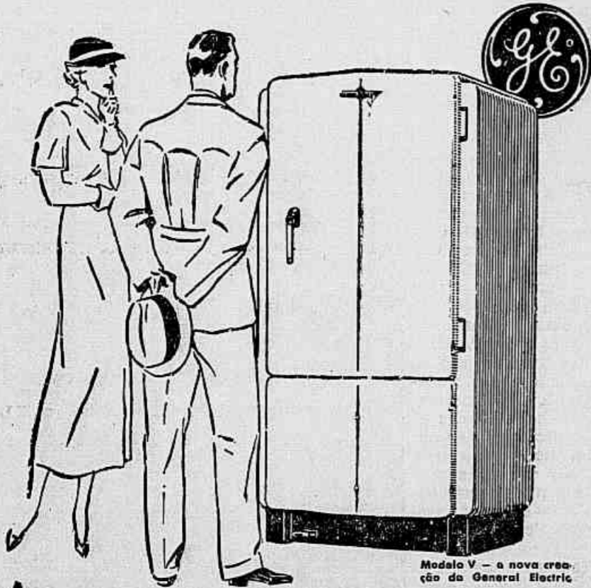
Modelo V - a nova criação da General Electric

PREÇOS REDUZIDOS E ESPECIAES CONDIÇÕES DE PAGAMENTO!