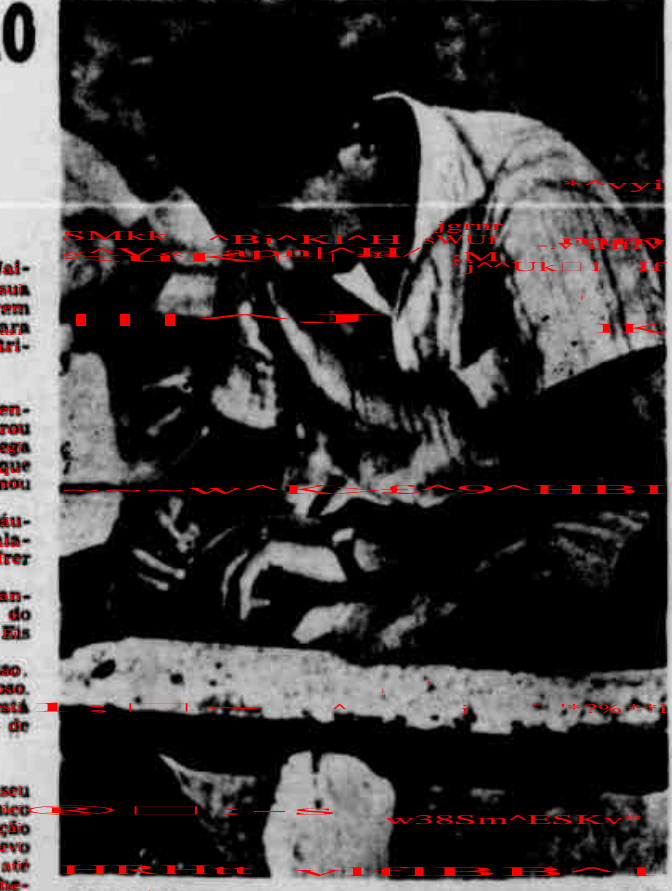
Jaime: "Não aguento mais as críticas e deixo o Santa"