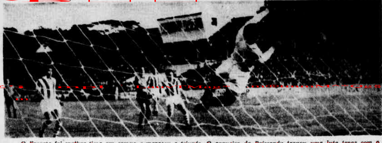
O Esporte foi melhor time em campo e mereceu o triunfo. O arquiri do Paissandu travou uma luta tenaz com o ataque rubro-negro

BELEM DO PARÁ, 17 (De Estanislau Oliveira, enviado especial de UH) — A delegação paranaense investiu armada de cassetetes e revólveres para impedir o linchamento do árbitro Nelson Bento de Oliveira e seus auxiliares, por parte dos torcedores do Paissandu, no jogo do último domingo, no estádio do Souza, em Belém do Pará.