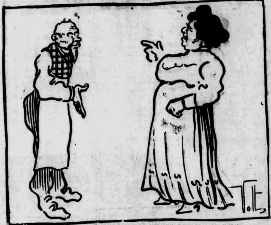
— Mas você não tem cara de construído. Até parece um escravo do Ajajo de Mendicidade... — Que quer, patrão? A luota pela vida faz a gente variar de profissão...