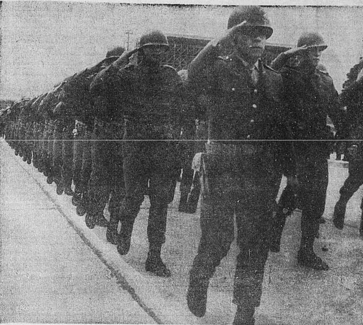
Incluindo o tradicional desfile, várias solenidades assinalaram ontem a passagem do Dia do Soldado. O Centro Cívico foi o palco do acontecimento, complementado, à tarde, na rua Marechal Deodoro. (Leia na página 8)