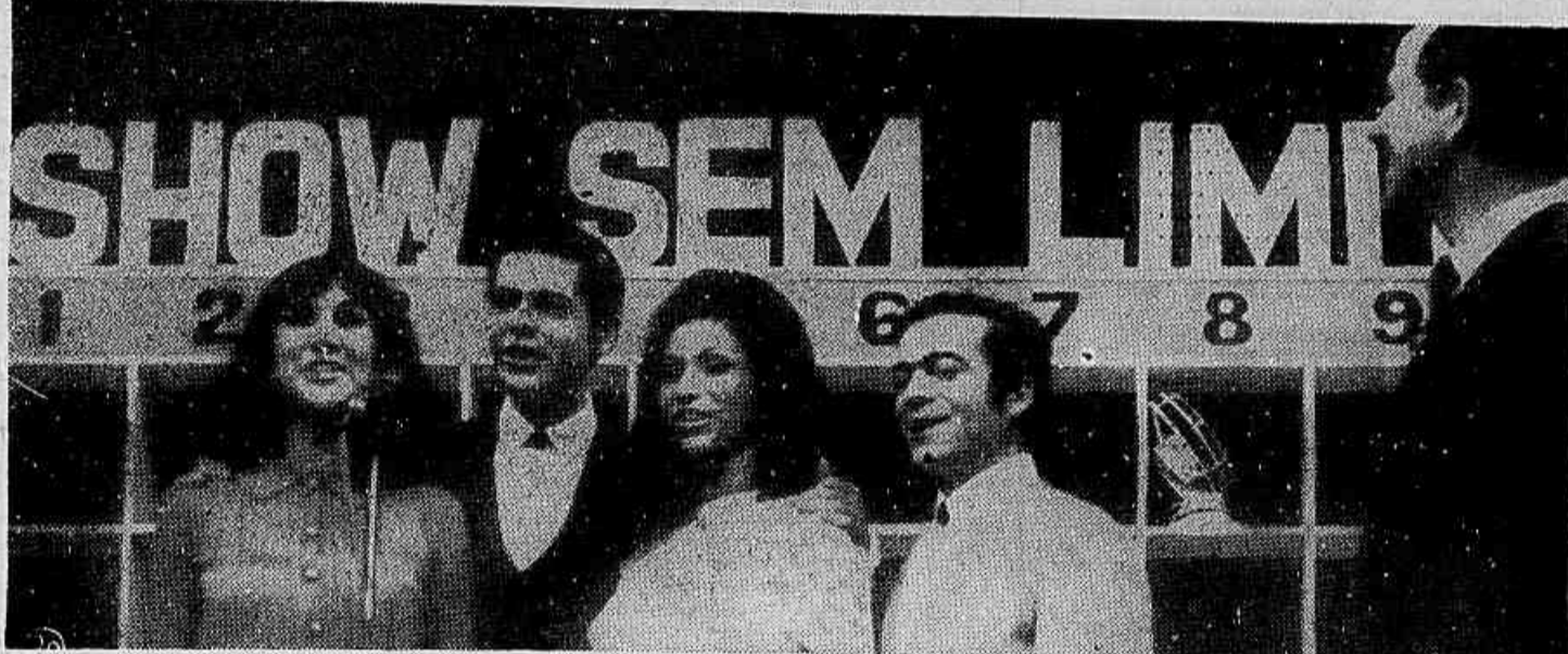
É uma das mais interessantes seções do Show Sem Limite. Os maiores artistas estão sempre presentes.