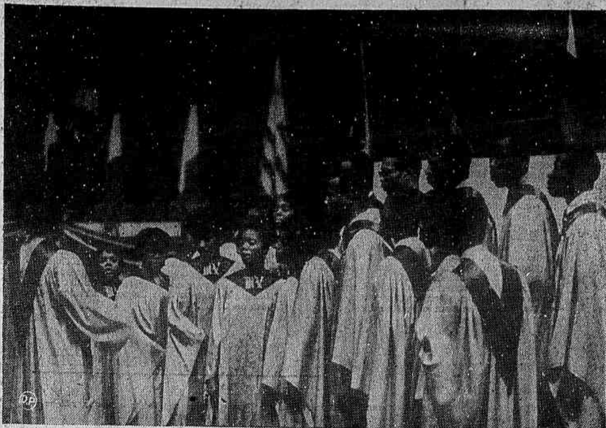
Alheios aos problemas temporais, seiscentos homens realizam, na Guanabara, o Primeiro Congresso Pan-Americano de Homens Batistas. Um coral de negros norte-americanos, do mesmo credo, prestigia o encontro. (M)