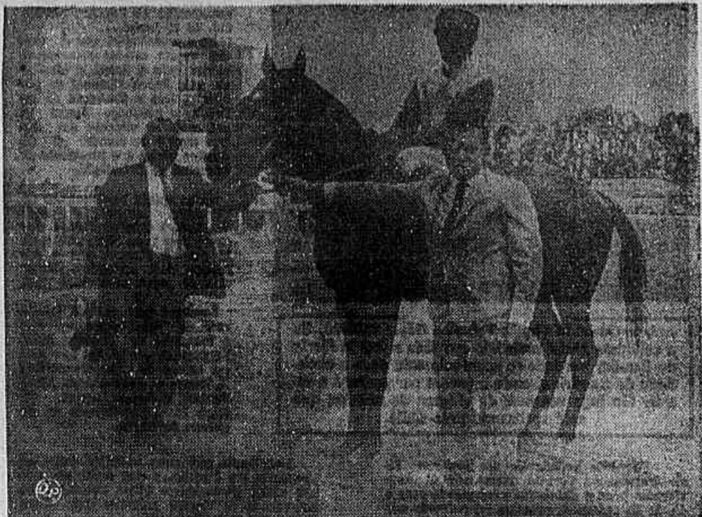
Em condições normais, o útil Net Fishing poderá ser a surpresa da 3.ª prova de domingo.