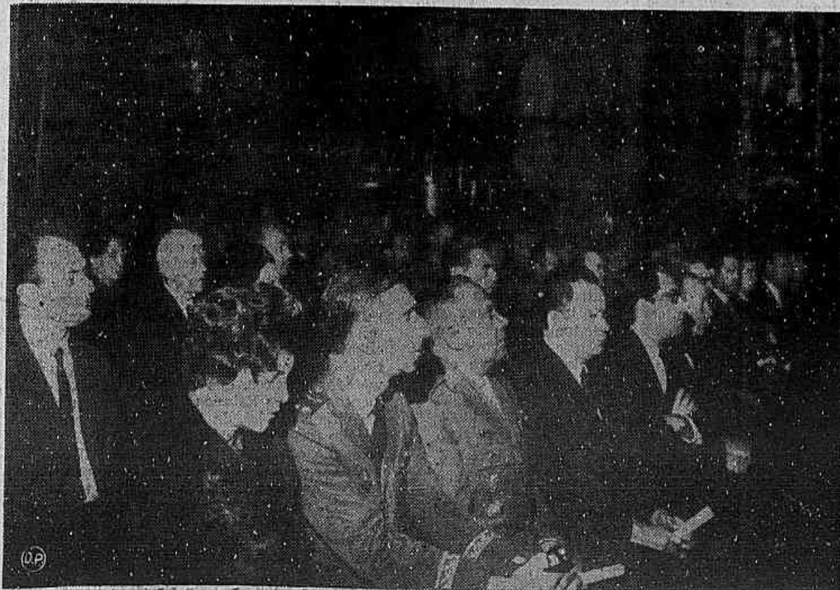
Oficiou-se na Catedral Metropolitana a missa de 1.º aniversário da morte do marechal Castello Branco, mandada celebrar pelo Governo do Estado, S.º RM e E.OEG. Presentes autoridades e centenas de fiéis. — (1.ª do 2.º)