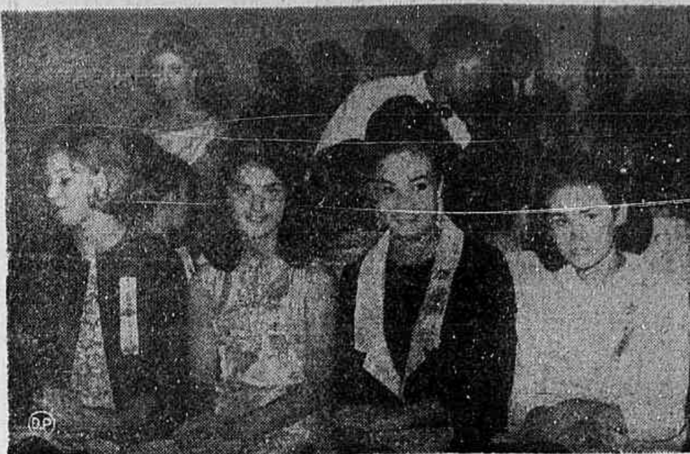
SORRISO DE MISS

Foram entrevistadas capítulo a capítulo, respondendo a uma série de perguntas ligadas diretamente ao certame. Muitas candidatas mostraram uma versatilidade que mereceu telefonemas de cumprimentos dos telespectadores.