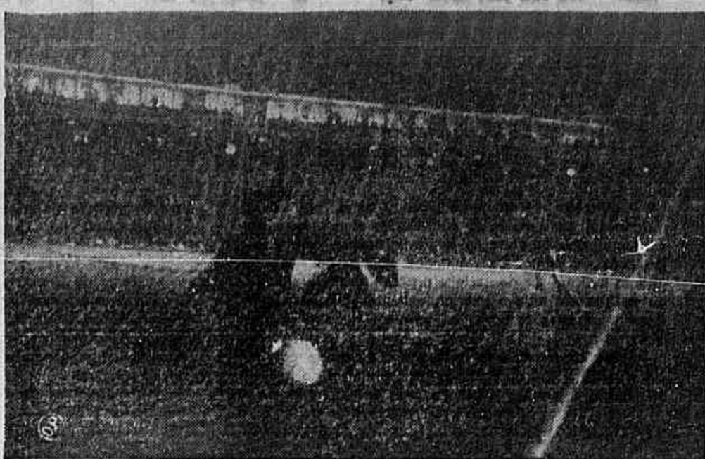
A GOLEADA — Foi uma noite de festa para o futebol brasileiro, a vivida na última quarta-feira em Maracanã. Primeiro pela revanche. Em Bruxelas fora de 5x1. Um selecionado que se atirara à uma autêntica aventura. No Maracanã, o marcador de 5x0 foi uma desabafo do torcedor, que estava vingado em seu orgulho ferido. Mas outra alegria seria registrada na noite memorável. A volta do Garrincha, em plena forma, jogando o futebol excelente que sempre praticou, provando que para a Copa de 66, o Brasil pode contar com êle. E houve Pelé. Como sem pre. Insinuante, desconcertante, goleador nato, com três gols espetaculares. No segundo foi cumprimentado até por Nicolay, o grande arqueiro belga, que num dos gols, foi obrigado a lamentar apenas, sentado, como figura clássica de uma derrota.