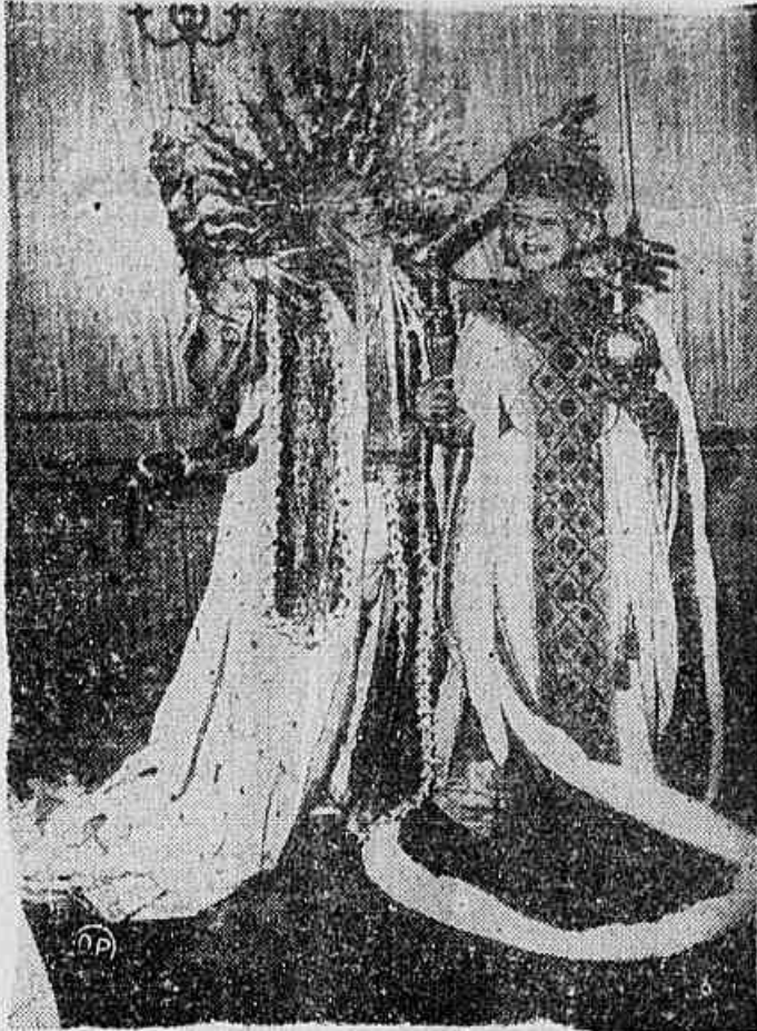
LUXO NO MUNICIPAL

NOS ESTADOS Do ponto de vista pesadista, a aproximação com o sr. Magalhães Pinto, em termos altos, propiciada em Minas Gerais, o PSD e majoritário, o clima capaz de permitir um governo construtivo sem dissensões que o prejudiquem. Do ponto de vista nacional o esquema se refletirá em primeiro lugar no Congresso, cuja autoridade seria fortalecida. Após a concentração amanhã, em Belo Horizonte, o programa pesadista terá sua repetição em outros Estados.