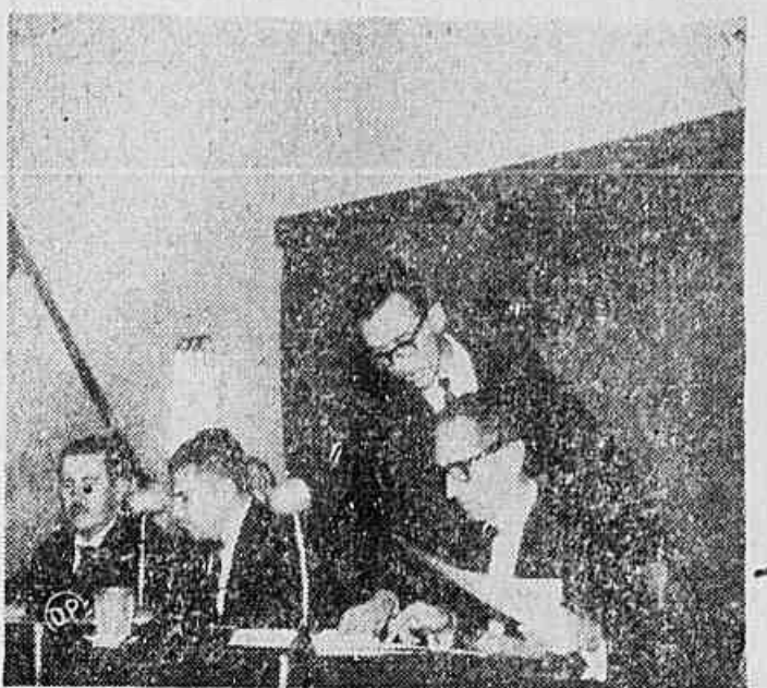
REABERTURA DA CMÁR MUNICIPAL

IMEDIATAMENTE — O senhor Janio Quadros não quis perder tempo; decidiu imediatamente que o Ministério do Exterior tome as medidas para o reatamento de relações com o mundo comunista. Enquanto o Itamarati tomava suas providências de rotina, enviava emissário à cortina de ferro. Ainda aqui, divide-se a opinião brasileira objetiva — e não aquela emocional e simplesmente política — sobre se teríamos ou não vantagens com a nova orientação em perspectiva.