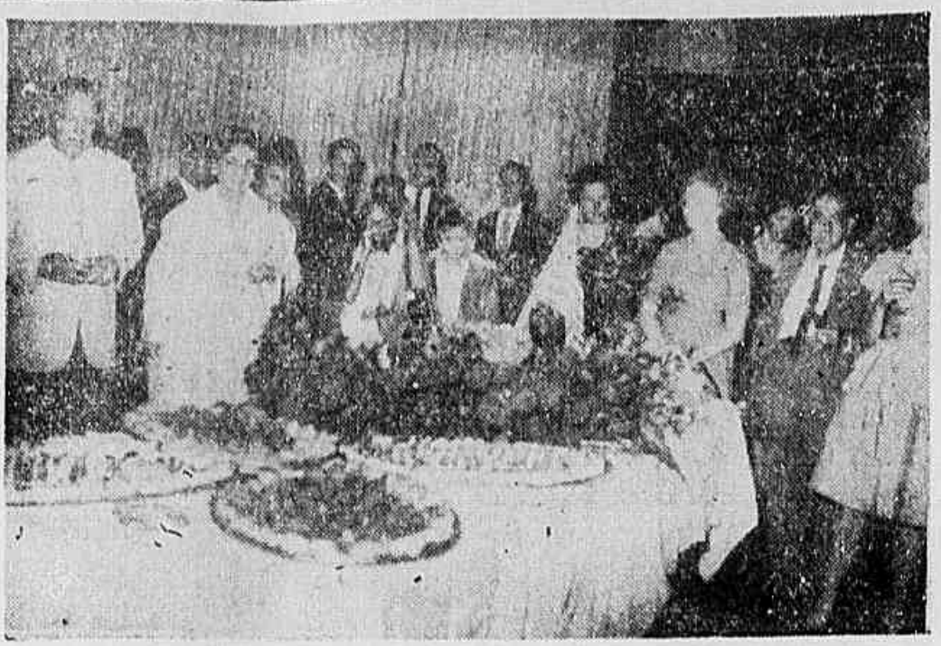
IMPERATOR ROSACRUZ EM CURITIBA