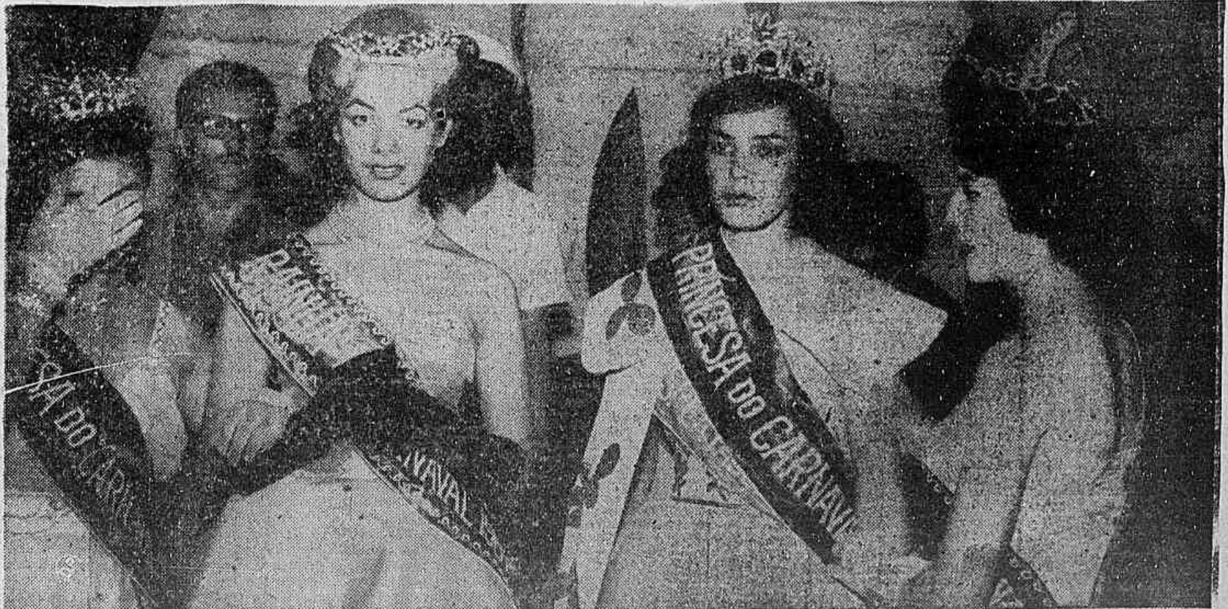
A MAIS BELA

Magia de luzes e cores voltou a se repetir no Teatro Municipal, centro do melhor carnaval do mundo, quando se exibiram majestosas fantasias que custaram a seus donos várias centenas de milhares de cruzeiros. Na foto da Meridional, as duas fantasias que mais despertaram a atenção, no concorrido concurso que ali se realiza todos os anos.