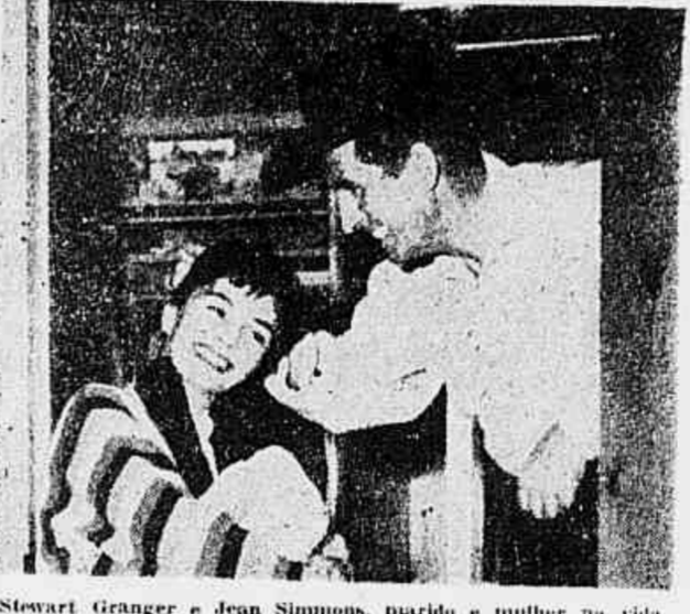
Stewart Granger e Jean Simmons, marido e mulher na vida real, cristalizaram-se frequentemente quando ambos filmavam nos estúdios da Metro: ela em 'Esta Noite ou Nunca' e ele em 'A Arma de um Bravo'.

HISTÓRIA: É A HISTÓRIA DE UMA MULHER ESTRANHEIRA, IRENE RICHARD, indiana em Roma, com seu marido George, e um filho de dez anos. O rapaz transcorreu sua infância em Londres, durante a guerra, sob o tremendo bombardeio e o nervosismo e pessimismo próprios da época; cresceu melancólico e hiper-sensível. Agora não se abandona do pai, mas, ao assim se julga, sempre preocupada com os desenvolvimentos e compromissos sociais próprios de sua classe, pois o marido é um diplomata. O garoto recorda com profunda saudade a nostalgia e período em que esteve internado em uma casa de saúde para operar-se de um apêndice, quando sua mãe fora toda sua por longo tempo ali com ela ao seu lado de doente. Profundamente abatida e desespurada, o menino se atrai do pai, não da escola. Por fim, depois de uma alternativa entre a escola e a deslocação de seu pai, o menino se atrai do pai, não da escola. Por fim, depois de uma alternativa entre a escola e a deslocação de seu pai, o menino se atrai do pai, não da escola.