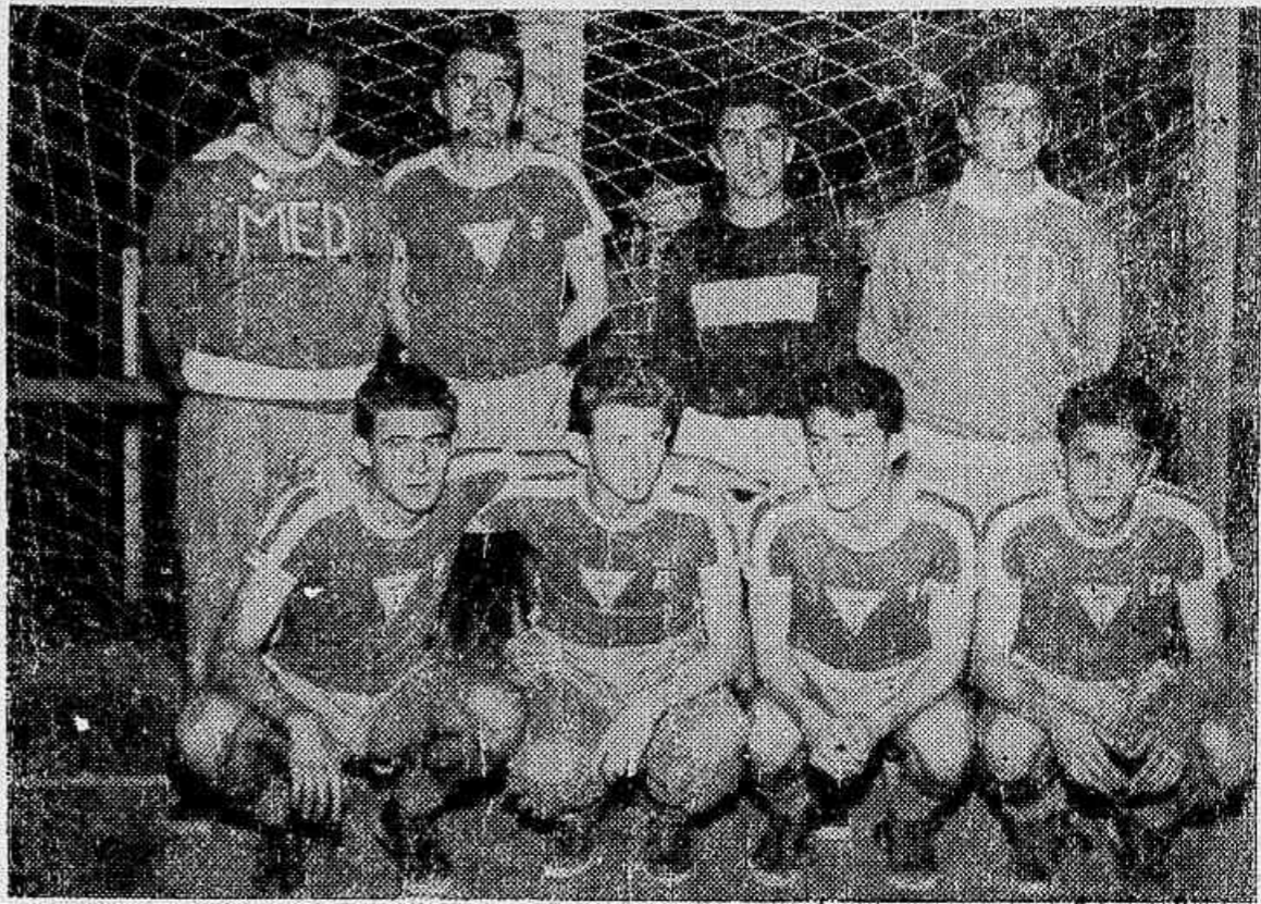
No clichê vemos uma das formações da equipe da Medicina que no ano passado fez boa figura. Este ano com uma equipe um pouco remodelada irá estreiar na noite de hoje frente ao Curitiba

A FRASE DO DIA: — "O 'pau cantou' domingo na Vila". (Um torcedor que presenciou o "charivari" no vestiário do Ferrovário).