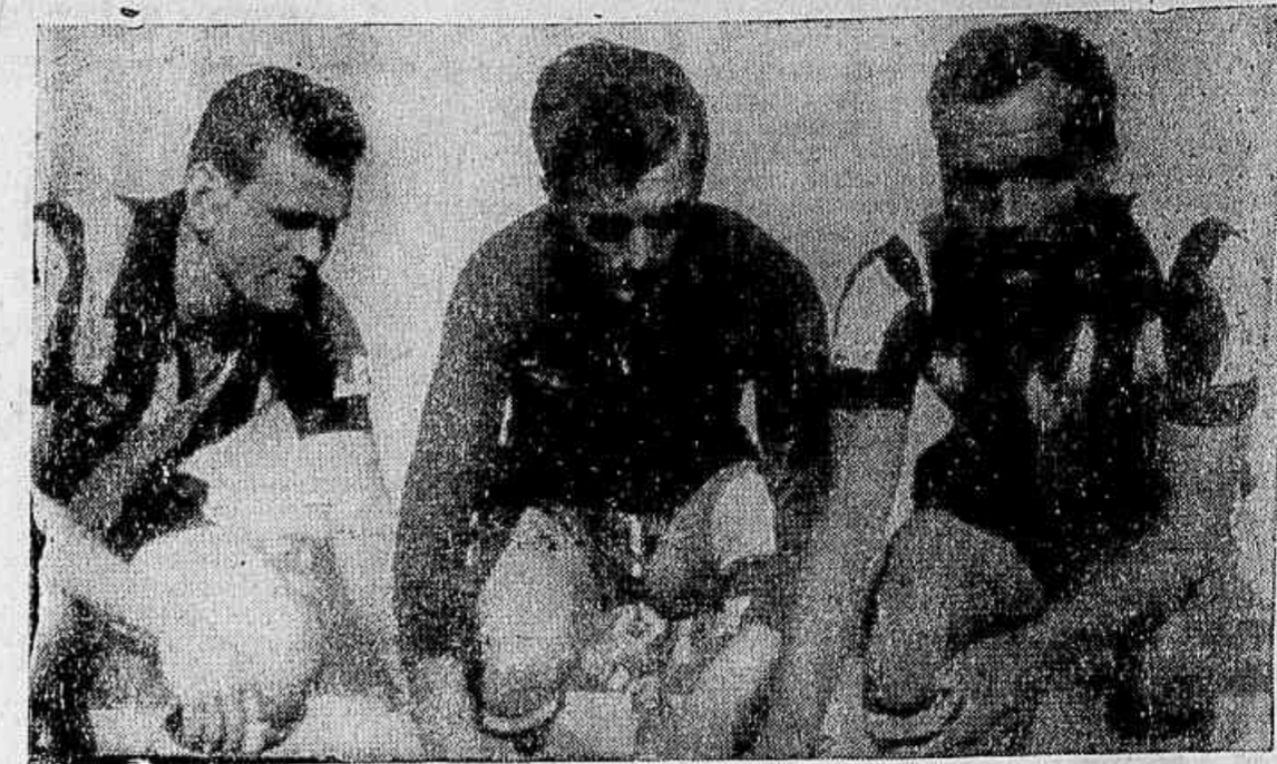
Elementos do sistema defensivo do Iguaçú (trio final) em foto para o "Paraná Esportivo"