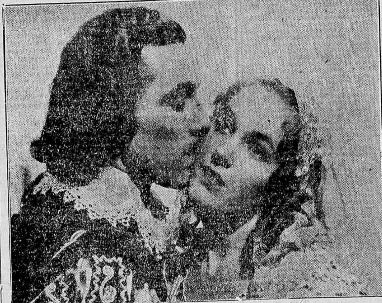
SCENA DO FILME "CARDEAL RICHELIEU"

Um dos mais feis historiadores do Cardal Richelieu já escreveu que elle viu sempre na necessidade do "se defende" do mesmo tempo da fraqueza de um e da malleia de muitos. Esse "um", demasiado fraco, era Luiz XIII, rei de França, e os "muitos" milliciosos era toda a sua corte, mas principalmente as duas rainhas, Maria de Medicis e Anna de Austria. Quando, segunda-feira, a United Artists tiver estreado "Cardel Richelieu" no Broadway, através da interpretação maravilhosa que George Arliss empresta ao conselho de Luiz XIII vamos conhecer melhor, e mais detalhadamente, o que foram suas lutas constantes contra os huguenotes, que elle perseguia e tentou destruir com quantas forças Deus o havia contemplado. Os protestantes formavam em França um verdadeiro Estado e para destrui-los essa força poderosa, o ministro de Deus, do Estado, queimou o melhor de suas energias. Ha na biographia desse homem episodios curiosissimos, inclusive o que provocou tambem a sua perseguição constante aos duelles. Essa "malleia mania" — como a chamavam — dizimo mais de 4.000 fidalgos em menos de vinte annos. São episodios da vida agitada desse sacerdote imulacionado em coisas do Estado, que George Arliss vai mostrar-nos, em "Cardel Richelieu", outro espectáculo privilegiado que a United offerece ao amigo "fan", segunda-feira proxima no Broadway.