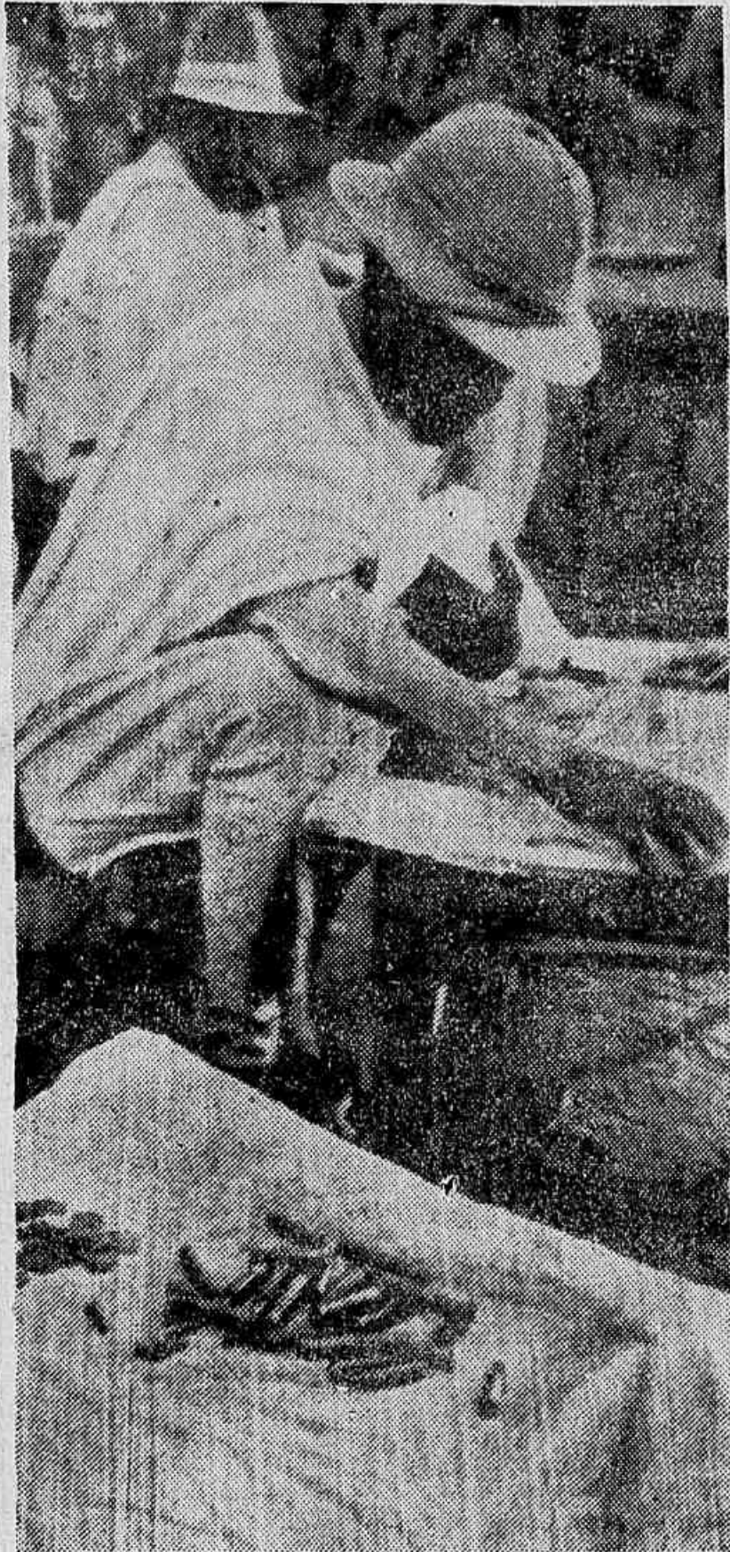
Nas proximidades de Harrar — Um soldado ethiopo, esperto... Em seu "estabelecimento", troca munição por café ou qualquer outro alimento. Certamente não regeitará uma moeda por um cartucho...

Apesar de todo o interesse da Inglaterra, é pouco provavel que isso aconteça — Ligeiro historico sobre o famoso canal que é, actualmente, o ponto nevrálgico da politica mundial