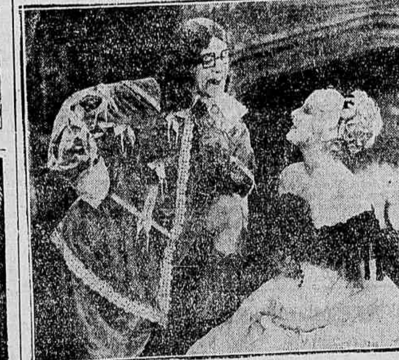
Scena do filme "Bambas da Idade Média"

Uma historia que se reveste dos lances mais comicos, entremeados de incidentes alegres, boa musica, excelentes cores, enfim "Bambas da Idade Média" é todo movimentadamente alegre e divertido. Bert Wheeler, Robert Woolsey, Thelma Todd, Dorothy Lee e Noah Berry, formam o elenco escolhido dos artistas. O "Alhambra" fará a sua grande estreia dentro de breves dias.