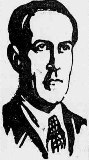
SR. OSWALDO ARANHA

Vamos ter moedas comemorativas do terceiro aniversario da revolução de outubro