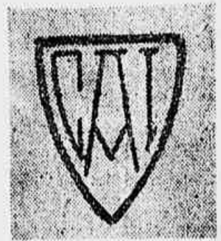
Paulista treina cestobol amanhã