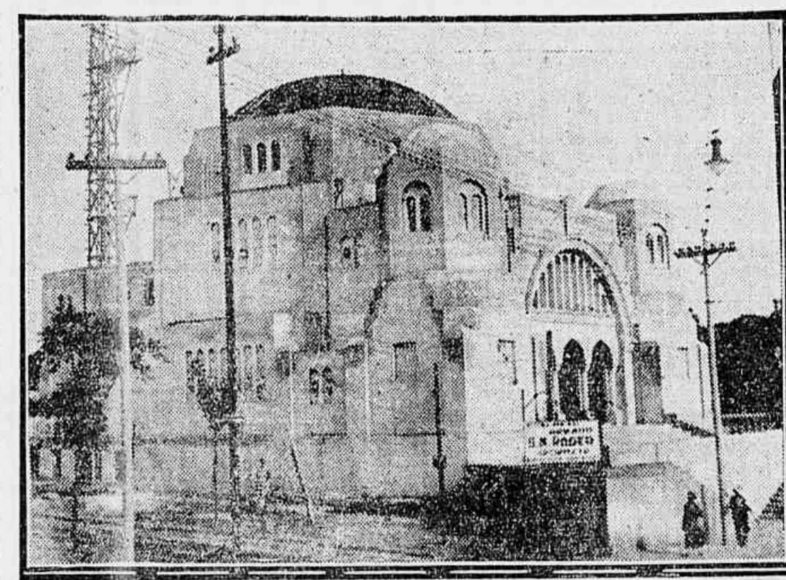
O IMPONENTE TEMPLO ISRAELITA DA RUA MARTINHO PRADO

Fêre instantaneamente a vista de quem entra em uma synagoga, a simplicidade do ambiente, em que israelitas de todas as idades,