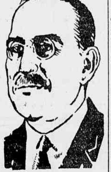
GENERAL AUGUSTIN JUSTO

O presidente da Argentina partirá da capital portenha no proximo dia 2 de outubro