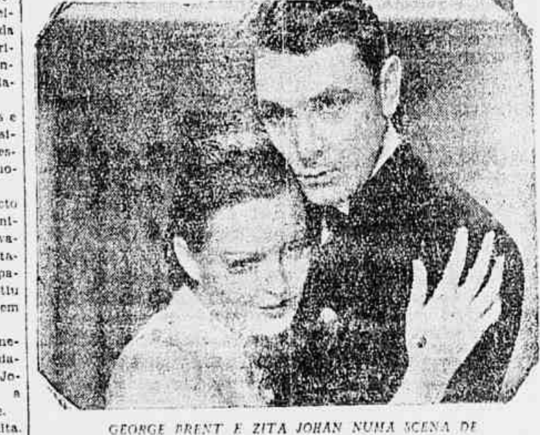
GEORGE BRENT E ZITA JOHAN NUMA SCENA DE "TRANSATLANTICO DE LUXO"

Atrás de todas as producções de Hollywood, uma das collas que se sentem flagrantemente é que os autores debalde buscam já descobrir ambientes novos em que situar os seus argumentos. Tudo tem sido vastamente explorado — salões nobres, campos de esporte, interiores de hotéis, salas de clubes, salões de conferencias, hospitales, tribunales, etc. — e debalde procuram os autores uma novidade de ambiente, sem que consigam descobri-la.