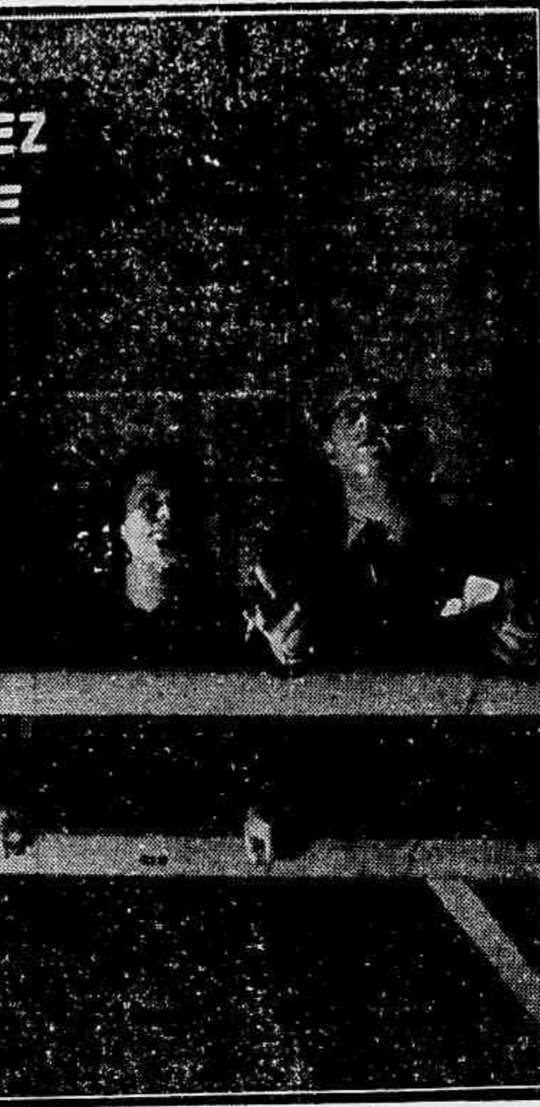
Um dos organismos mais sérios que, na Europa, se dedicam ao estudo do cinema...