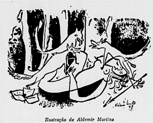
Ilustração de Aldemir Martins