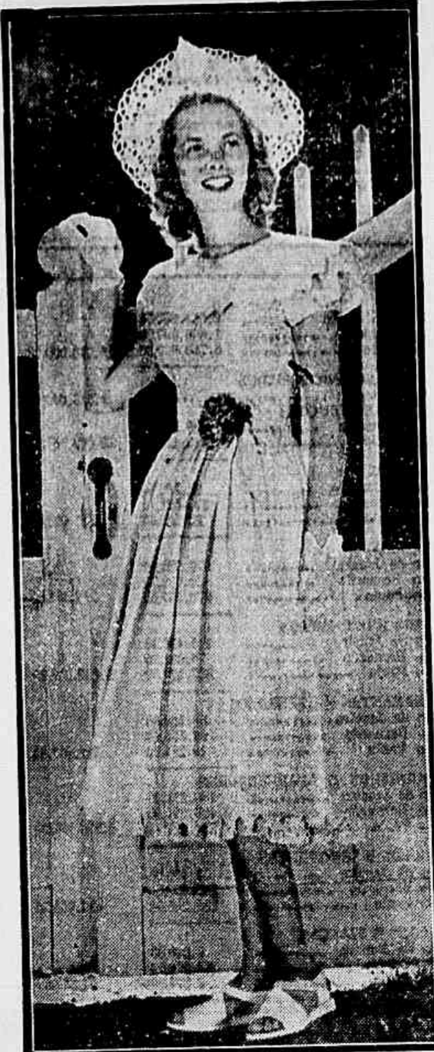
JANET LEIGH, que teve tão bom papel em "INVERNO D'ALMA", ao lado de Walter Pidgeon e Deborah Kerr...