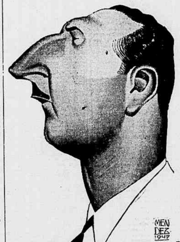
Mais do que nunca o governador Adhemar de Barros organiza com decisão as suas forças, a fim de travar com firmeza a grande batalha de 50

Conforme tem sido anunciado, realizou-se hoje, às 9 horas da manhã, à praça da 86, 217, 2º andar, uma reunião do Comité Gráfico da Defesa da Autonomia Sindical do P.S.B.