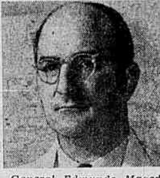
General Edmundo Macedo Soares

A candidatura do general Macedo Soares ao governo do Estado do Rio — eis um fato político que ajuda a prestigiar a democracia. Não é comum, infelizmente, entre nós vermos uma personalidade de alto teor intelectual e moral aceitar sua participação nas reftregas populares. Fica o campo franqueado aos medocres e aos vulgares e cada vez mais se isolam na torre de marfim os homens de valor. Devemos, pois, saudar com um hosana o aparecimento de um nome como o de Edmundo Macedo Soares na competição eleitoral fluminense de outubro próximo. O criador da Siderurgia de Volta Redonda e atual presidente da Mercedes Benz é