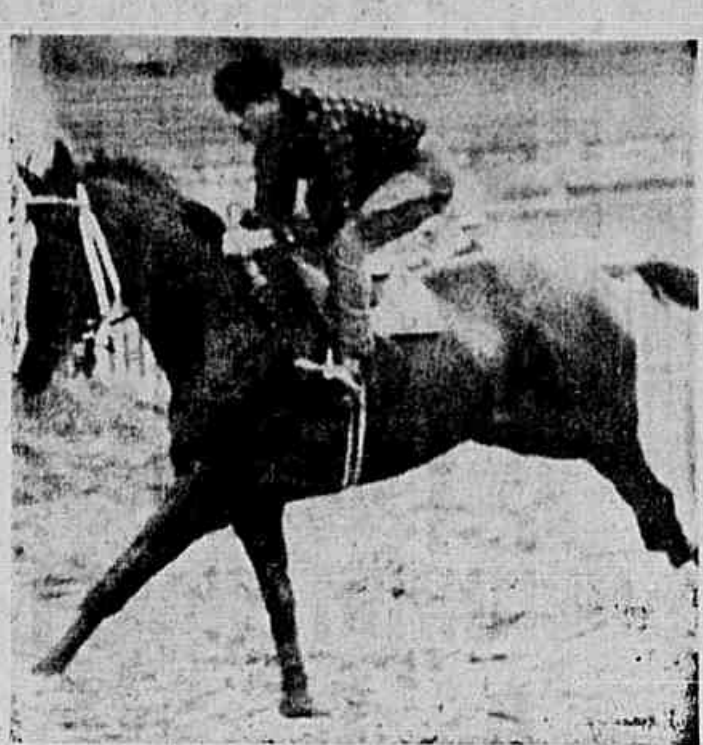
Vernal, o craque argentino que esteve em Cidade Jardim, nas festas do G.P. "São Paulo", comparecerá à Gávea, este ano, para a programação da festa magna do nosso turfe, devendo competir, com o companheiro Vernet, no G.P. "Presidente da República", com a dotação de Cr$ 2.000.000,00. Na mesma semana deverão embarcar, além de outros parceiros, os craques Dorine, Montecristo, Andino e Trisca, dos mais capacitados ao Grande Prêmio "Brasil".

finivamente afastado das pistas, não podemos dispor de um crioulo cuja superioridade esteja amplamente definida. Ortille tem, a seu favor, a última atuação frente a Arturo A, secundando o excepcional produto argentino em brilhante arremetida. O filho de Orbaneja, e Major's Dilemma, farão um último teste, juntamente com Iberius e Atramo, no próximo domingo, quando disputarão o "16 de Julho", na Gávea.