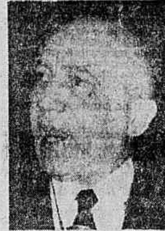
O Almirante Lúcio Moura, quando proferia a sua conferência inaugural no XVII Congresso da Associação Brasileira de Metais, na noite de segunda-feira

barito técnico, se constituiu no expedito sumário do dia e melhor promessa para os acontecimentos que ocorrerão ao correr de hoje.