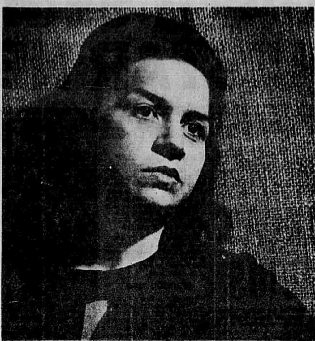
Figura do Dia

O filme japonês conta as vicissitudes de uma ex-atriz que deseja se divorciar. Obtido o divórcio, ela volta ao teatro e reconhece uma nova vida cheia de esperança. Ela recusa a proposta do marido de voltarem a viver juntos, e também rejeita numerosas ofertas de casamento. Enfim, resolve casar-se com um dramaturgo que conheceu há muitos anos, justamente quando sabe que ele está ferido no hospital.