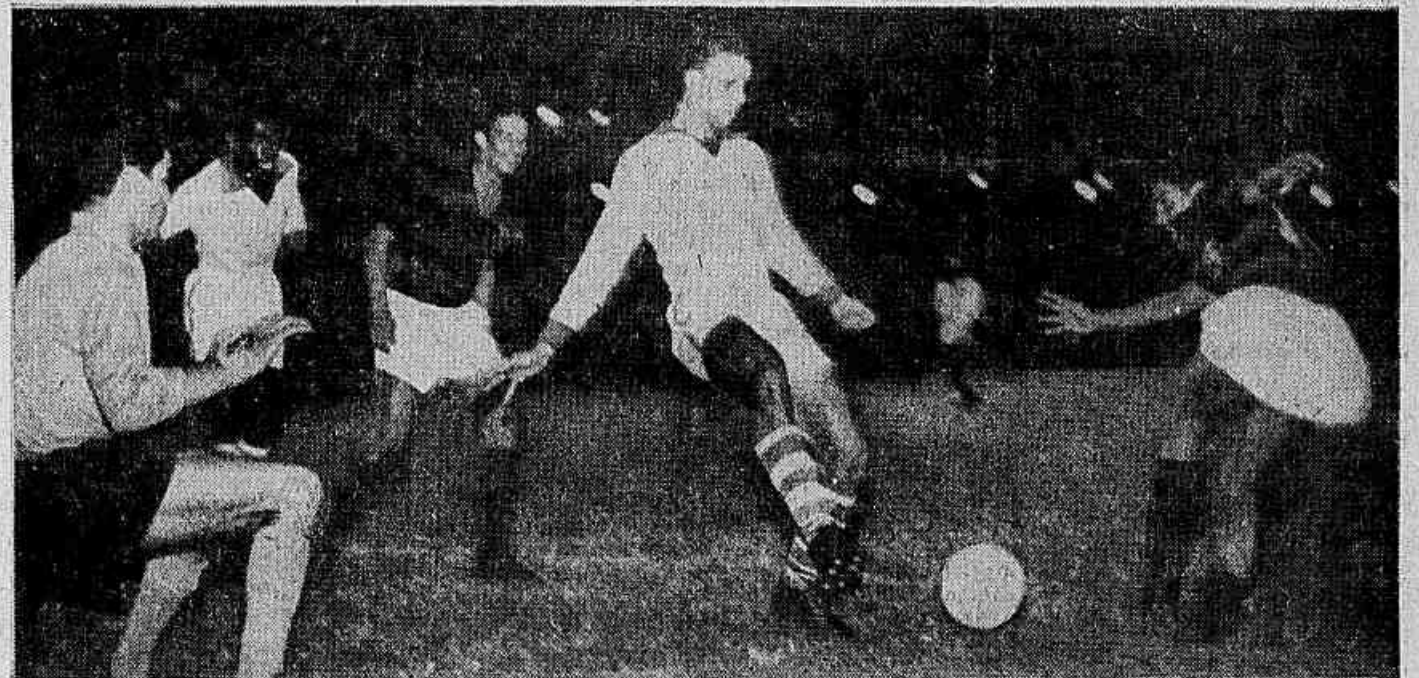
Voltando a ser o time dos "velhos tempos", o Flamengo goleou ontem à noite, no Maracanã, por 7 a 0, o Canto do Rio, numa partida em que seu meia Dida, em noite inspirada, consignou dois gols de "letra", enquanto defensores do clube ni-teroiense caíram de cansaço, sendo necessário, inclusive, serem socorridos pelo médico e levados a aspirar oxigênio. — (DETALHES NA PAGINA 12). —

Em seu discurso, reafirmou o Governador da Guanabara seus pontos de vista contra a infiltração extremista no País, acrescentando que, enquanto estiver à frente do Governo os agitadores não converterão a Guanabara "numa nova Caxias", pois "aquí não há lugar para pistoleiros". A seguir o Senador Padre Calazans, descreveu os horrores do comunismo.