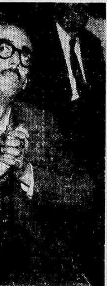
O governador Jânio Quadros penetrou, ontem, pela primeira vez, no recinto do Palácio Tiradentes, onde assistiu, da primeira fila, a homenagem prestada pelo Congresso ao marechal Cândido Rondon. O Sr. Jânio Quadros, sob a curiosidade geral, mantinha-se inquieto na poltrona, tendo sido surpreendido pelos fotógrafos em atitudes típicas. Eis, ao alto, como o surpreendeu o fotógrafo de A NOITE

Da conferência entre os dois próceres nada transpirou.