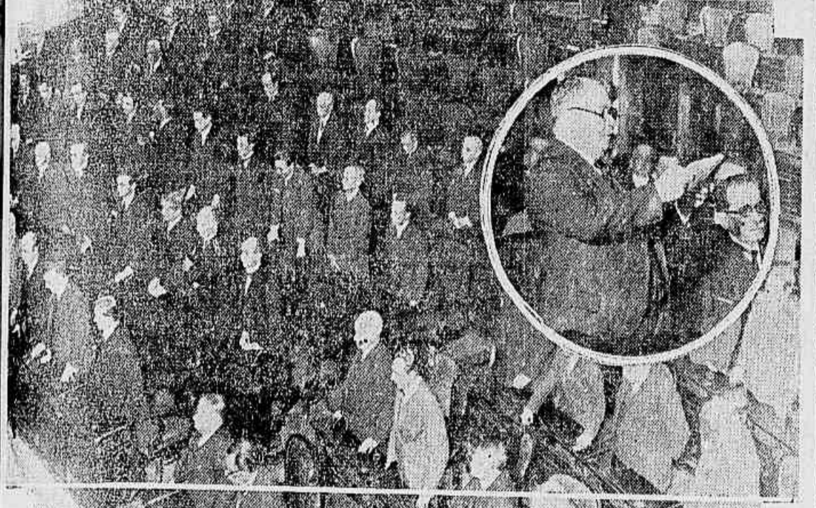
Aspecto da Camara, durante a sessão funebre, vendo-se os deputados de pé — No medalhão, quando falava um dos oradores

Parlamentar eloquente que o po- perambucando nos enviara, cheio de sonhos entusiasticos, para dar brim a todos os trabalhos legislativos, re- pta, hoje, transformado num corpo morto, para dormir o sono derradeiro na tranquillidade serena da terra natal.