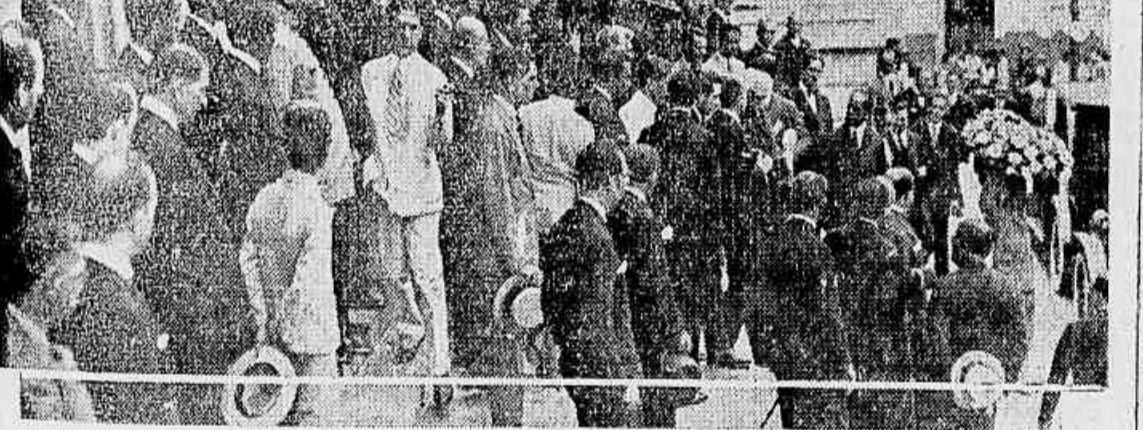
A urna funebre descendo em hombros a escadaria da Camara

revela, dos aliados moraes e ditados de seus matadores, os insul- a mais torpes. Hoje, honra e vergonha quem extranheza a Camara recolhe-se ao seu as- to, a honra e a vergonha quem extranheza a Camara recolhe-se ao seu as- to, a honra e a vergonha quem extranheza a Camara recolhe-se ao seu as-