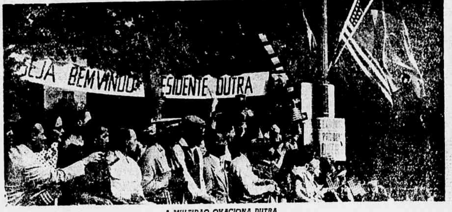
A MULTIDÃO OVACIONA DUTRA Esta fotografia, tomada em um cruzamento de ruas, em Washington, mostra parte das milhares de pessoas que se aglomeraram nas ruas da capital dos Estados Unidos, para ovacionar o presidente Dutra. Uma faixa de boas-vindas, onde se lê — "Seja bemvindo, presidente Dutra" — pode ser vista sobre as cabeças dos espectadores. Uma outra saudação de boas-vindas, escrita em inglês, é a que mostra o cartaz que se vê no poste de iluminação, decorado com as bandeiras do Brasil e dos Estados Unidos.