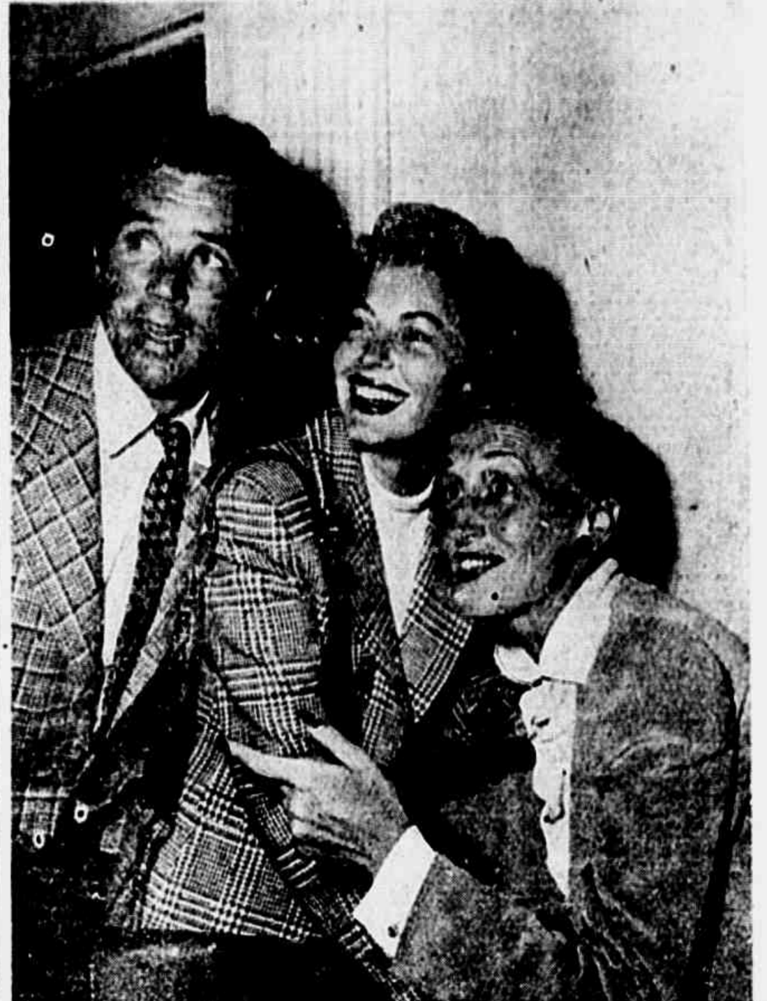
Usando roupas felizes com a mesma fantasia, Howard Duff e Ava Gardner são recebidos por Kay Thompson, estrela de um "show", em uma festa oferecida pela última. Começando a aparecer agora no cinema, Howard já é bem conhecido das audiências de rádio como "Sam Spade". Se por acaso não ouvir falar de Kay Thompson, ela é a moça que percebe um dos mais elevados salários pagos a artistas de clubes noturnos