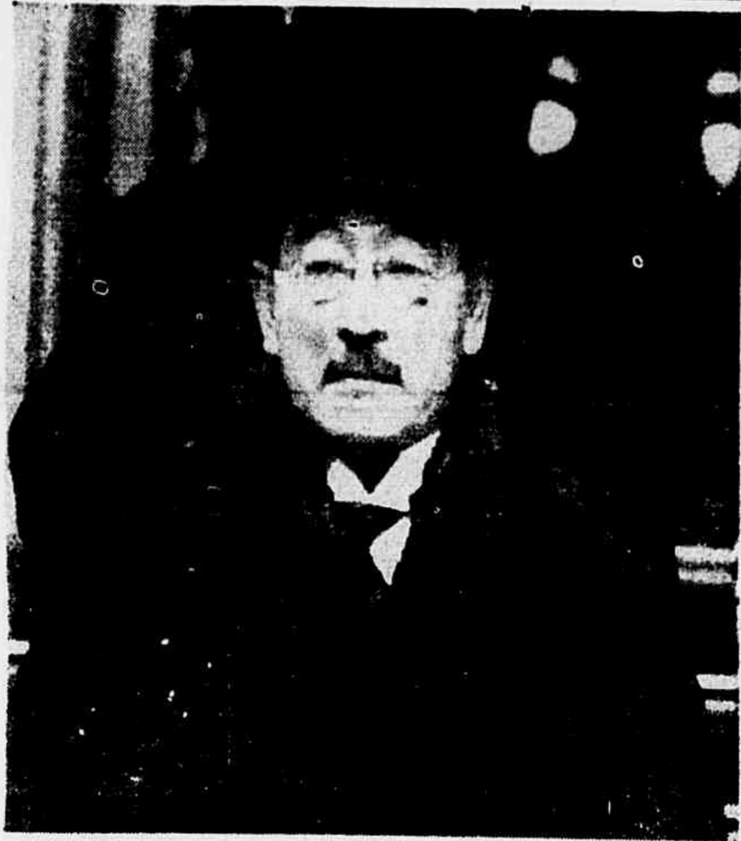
SABURO KURKUSO, cujo retrato acima apresentamos, é o enviado extraordinário de Tóquio a Washington, para cooperar com o embaixador Nomura, no sentido de evitar a guerra no Pacífico. As negociações, já concluídas, continuam, porém, sem nenhuma definição

VICHY, 22 (U. P.) — A Câmara de Apelação de Limoges rejeitou o pedido de extradição contra o cidadão espanhol sr. Largo Caballero, formulado pelo governo espanhol.