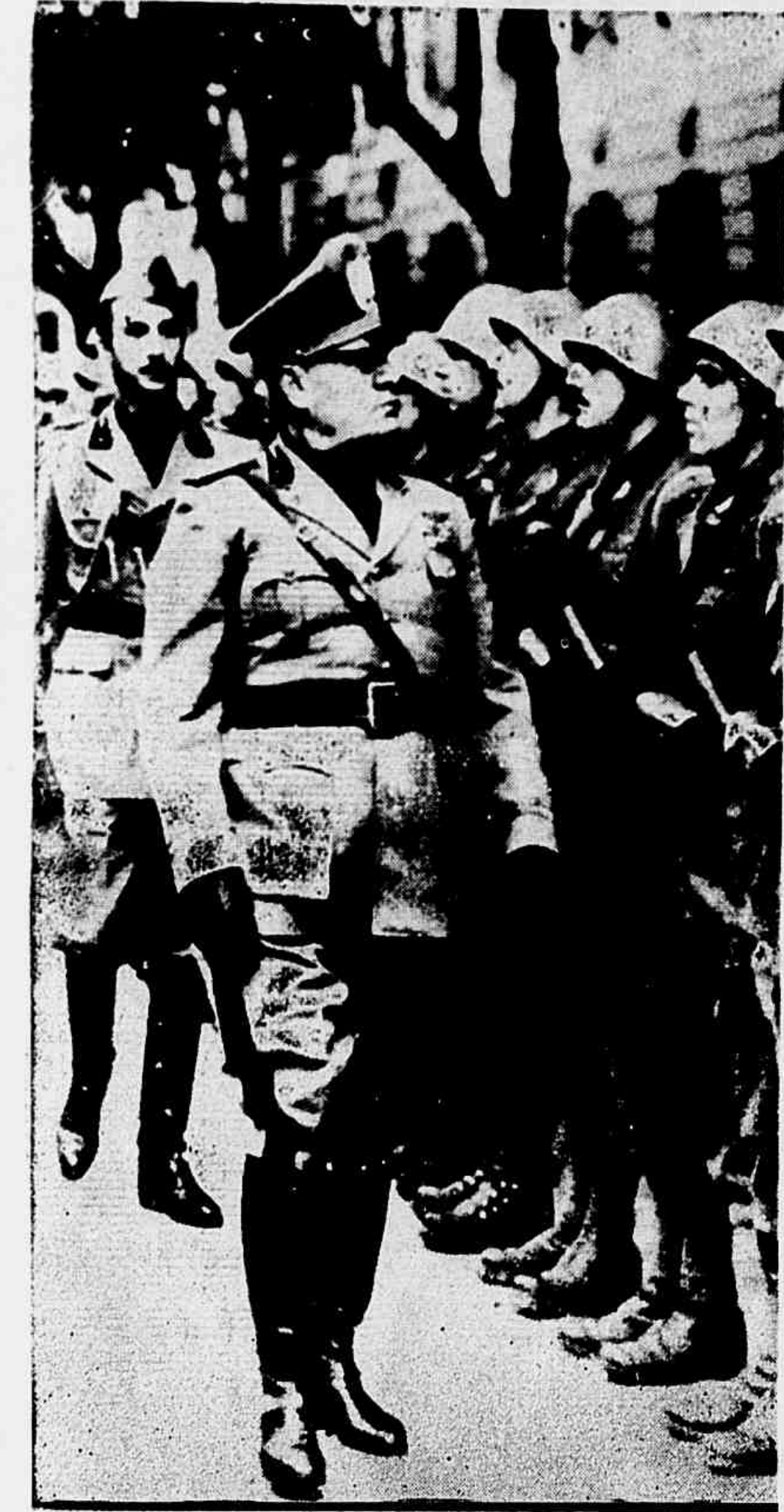
Mussolini passa em revista seus últimos soldados. A "Wide World Photos" apresenta os restos da tropa que o Duce mandou para a Líbia e Grécia, tropa que agora desaparece, diante da ação inglesa na África