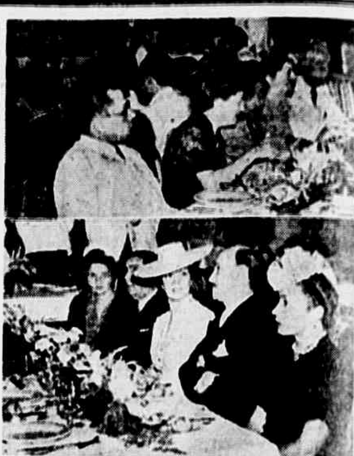
Homenagem do DIP aos chefes do Serviço de Registro de Estrangeiros... Realizada ontem, às 21.30 horas, no Casino da Urca.

Atenção para os moradores da Avenida... O Conselho de Imigração e Colonização está analisando as reclamações recebidas.