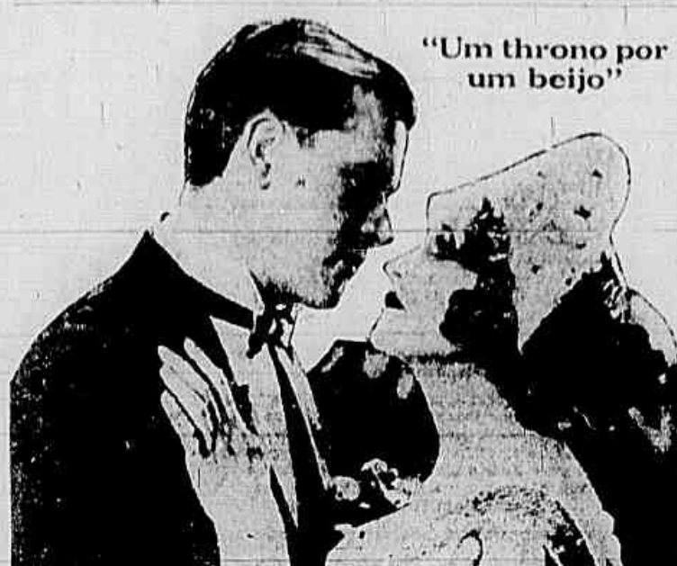
"Um throno por um beijo"