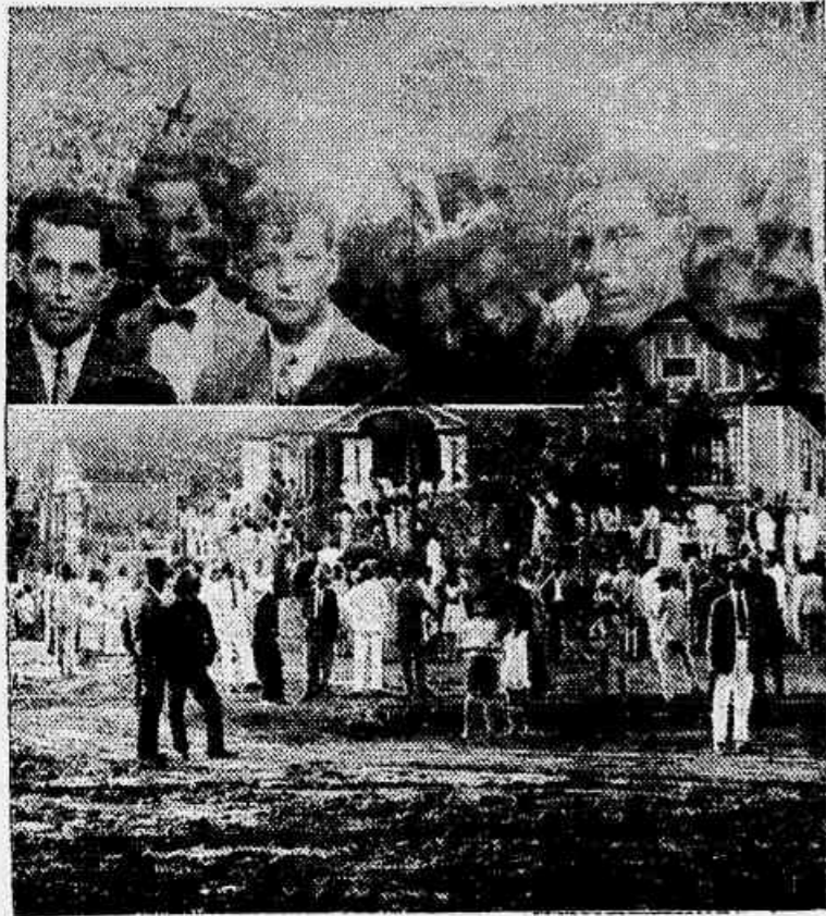
EM CATAGUAZES — MINAS — VE-SE NA PHOTOGRAPHIA O CRIMINOSO ENTRE O PROMOTOR DE JUSTIÇA DA COMARCA E O PREFEITO DO MUNICIPIO!

UM QUADRO IMPRESSIONANTE, QUE DESDOBRA-MOS AOS OLHOS DO SR. GETULIO VARGAS