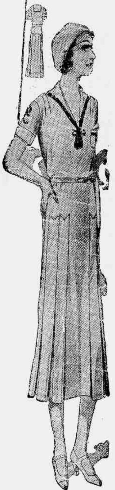
Um elegante vestido de passeio, também apropriado para os sports ligeros, como o golfinho e ping-pong. Blusa justa, saias longas e plissadas, trabalhadas em tecidos leves, em voga no momento.