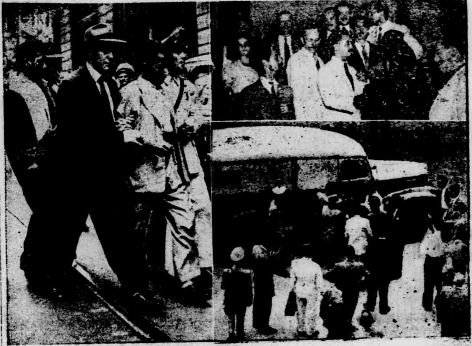
SAO PAULO (Meridional) — Fracassou o plano dos comunistas para promoverem agitação popular, em frente à Câmara dos Vereadores, no dia 1 do corrente, sob o pretexto de um protesto contra o racionamento de energia elétrica, tendo a polícia bandeirante cercado completamente o local e exercido severa vigilância nos pontos de acesso, com ordens rigorosas de reprimir qualquer perturbação. Foram presos vários comunistas já anteriormente fiéis dos e que dirigiam o movimento de agitação. A gravura acima reproduz flagrantes colhidos por ocasião dos acontecimentos, vem do lado à direita, dois comunistas quando eram conduzidos por policiais para um carro de presos. Ao lado, em cima, aparecem alguns vereadores fiéis do com o delegado da O.P.S. e, em baixo, quando os outros agitadores eram metidos no "turtireiro".