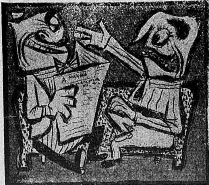
— Este voto talvez tenha sido um sorriso que ele não deu... —

(UM CANDIDATO NÃO FOI ELEITO POR FALTA DE UM VOTO)