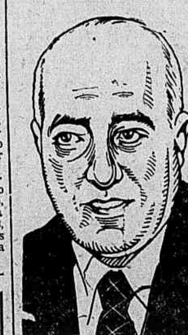
General Mendes de Moraes

O Presidente da República assinou ontem, o seguinte decreto: "O Presidente da República, na qualidade de Grão Mestre da "Ordem Nacional do Mérito" e nos termos do artigo 18 do decreto 21.845, de 26 de setembro de 1946, resolve conferir a "Ordem Nacional do Mérito" no grau de "Grã Cruz" ao General de Divisão Angelo Mendes de Moraes, prefeito do Distrito Federal, pelos bons serviços prestados à Nação".