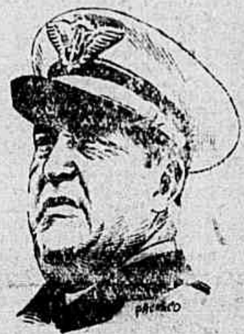
Ministro Armando Trampowski

Por decreto de ontem do Presidente da República publicado no D. O. que hoje circula, foi nomeado para exercer as altas funções de Ministro do Superior Tribunal Militar o tenente brigadeiro Armando Trampowski, atual titular da Aeronáutica.