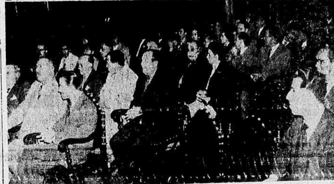
Aspectos colhidos durante o encerramento da convenção, vendo-se a mesa que presidiu os trabalhos e parte da assistência presente