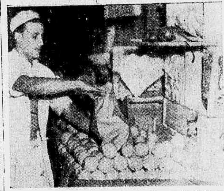
As laranjas do "Magdalena", expostas à venda, num caminhão-feira

Está sendo vendido nos caminhões-feira o carregamento que conduzia o transatlântico britânico