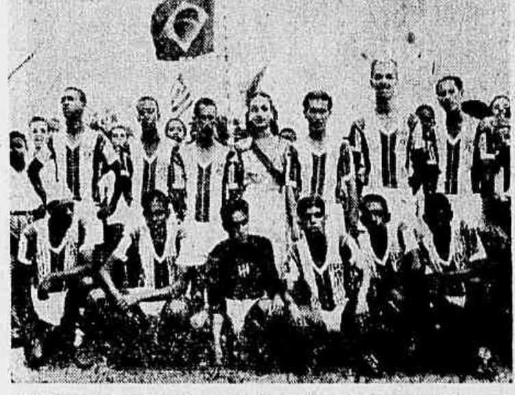
A valorosa representação do Timboim, Campeão da Leopoldina, que novamente estará em ação

NA PRAÇA DE ESPORTES DA RUA OURIQUE ESTE ENCONTRO