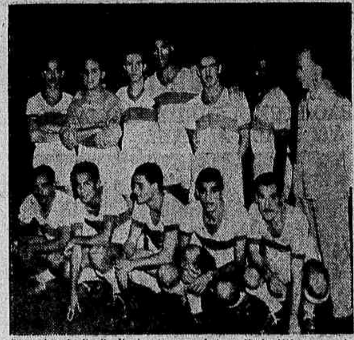
O quadro do F. C. Horizonte, que abateu sábado último o equipo do Centro Esportivo Rolas Aéreas F. C., pelo escore minimo.

ABATIDO O C. E. R. A. PELO ESCORE MINIMO — CECY, O AUTOR DO ÚNICO TENTO