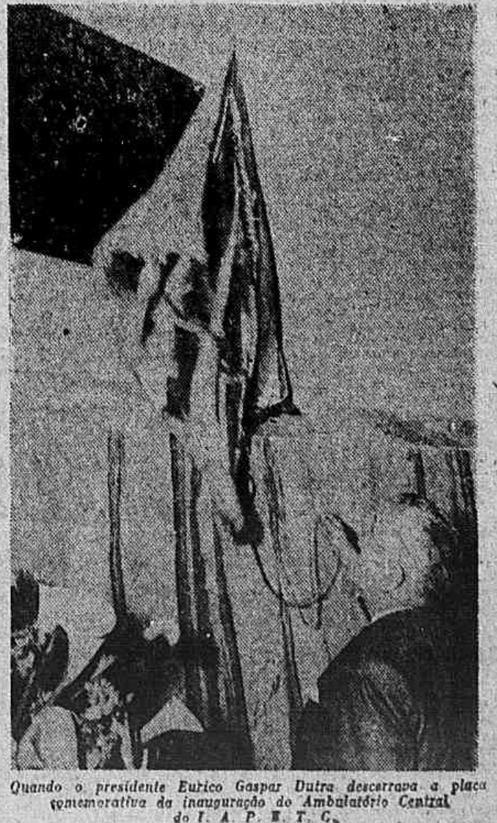
Quando o presidente Eurico Gaspar Dutra descrevava a placa comemorativa da inauguração do Ambulatório Central do I. A. P. E. T. C.