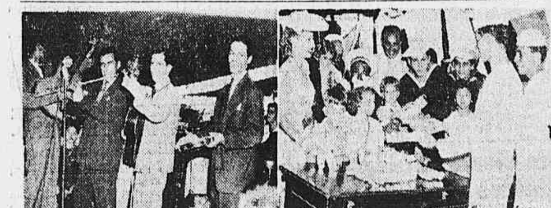
Dois instantâneos da festa no "Almirante Saldanha"

Um carregamento de 350.000 toneladas está sendo preparado para ser embarcado para esta capital — O produto será transportado em navios da Mala Real Inglesa — Reforço considerável para o abastecimento do Distrito Federal