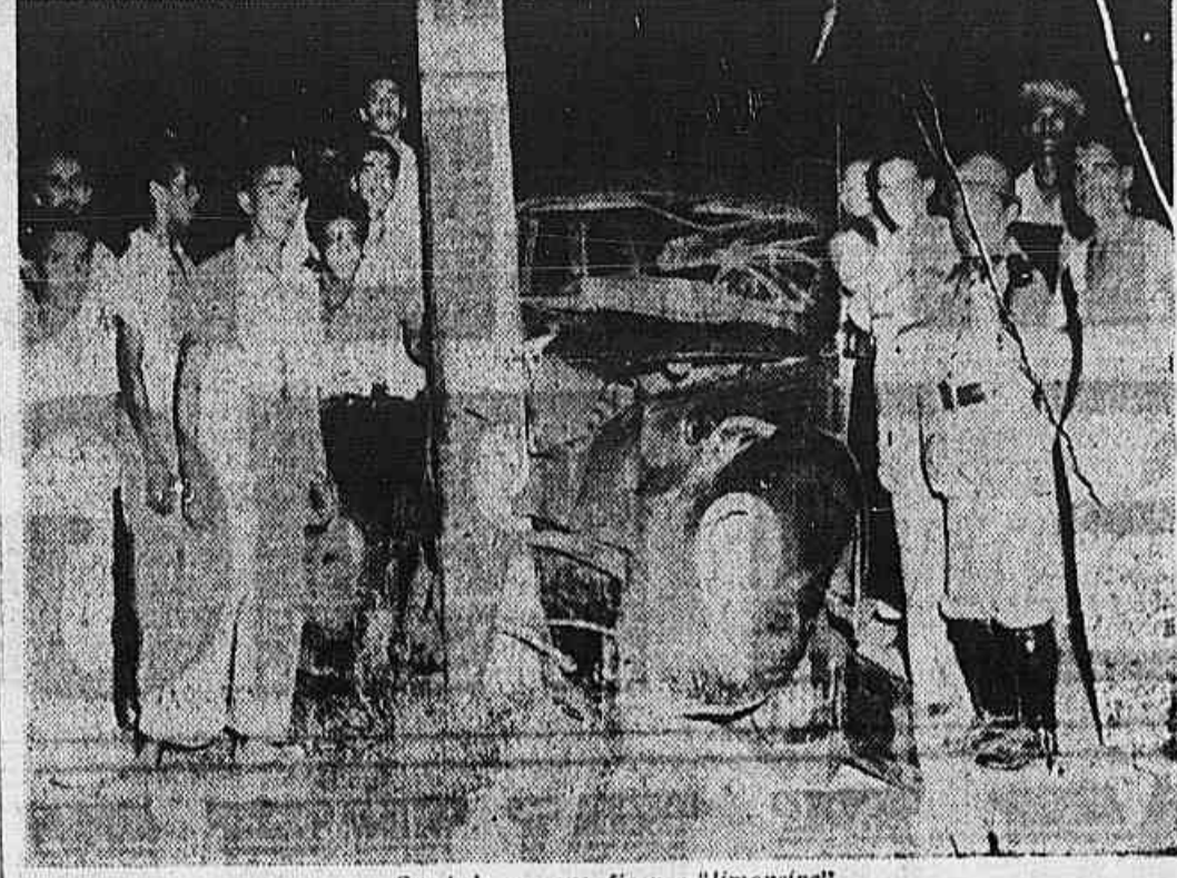
O estado em que ficou a "limousine"

Espectacular desastre na Avenida Brasil — Cinco feridos, um deles em estado desesperador