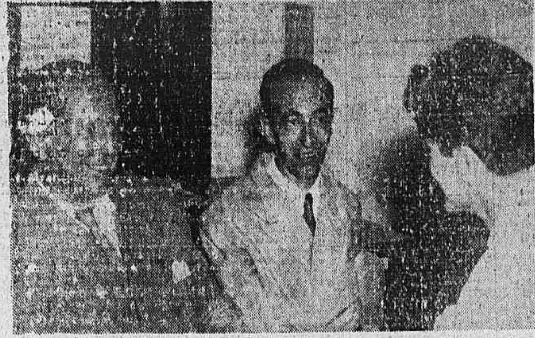
O Presidente e o Diretor de Propaganda do Iate Clube Itacurussá, em nossa redação falando a respeito.

Em nossa redação o presidente e um diretor do Iate Clube de Itacurussá — A construção da sede e garage do clube, no princípio do ano — O Carnaval no Iate — A Prefeitura já deu outro terreno para o campo de futebol