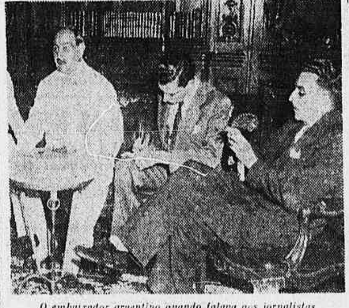
O embaixador argentino quando falava aos jornalistas

As 17 horas de ontem, o Embaixador argentino no Brasil, General Accame, reuniu os jornalistas, na sede da Embaixada, à praça de Botafogo, a fim de prestar declarações sobre assuntos importantes. No momento, a hora aprazada, encontravam-se na Embaixada representantes dos vários jornais cariocas e agências noticiosas nacionais e estrangeiras.