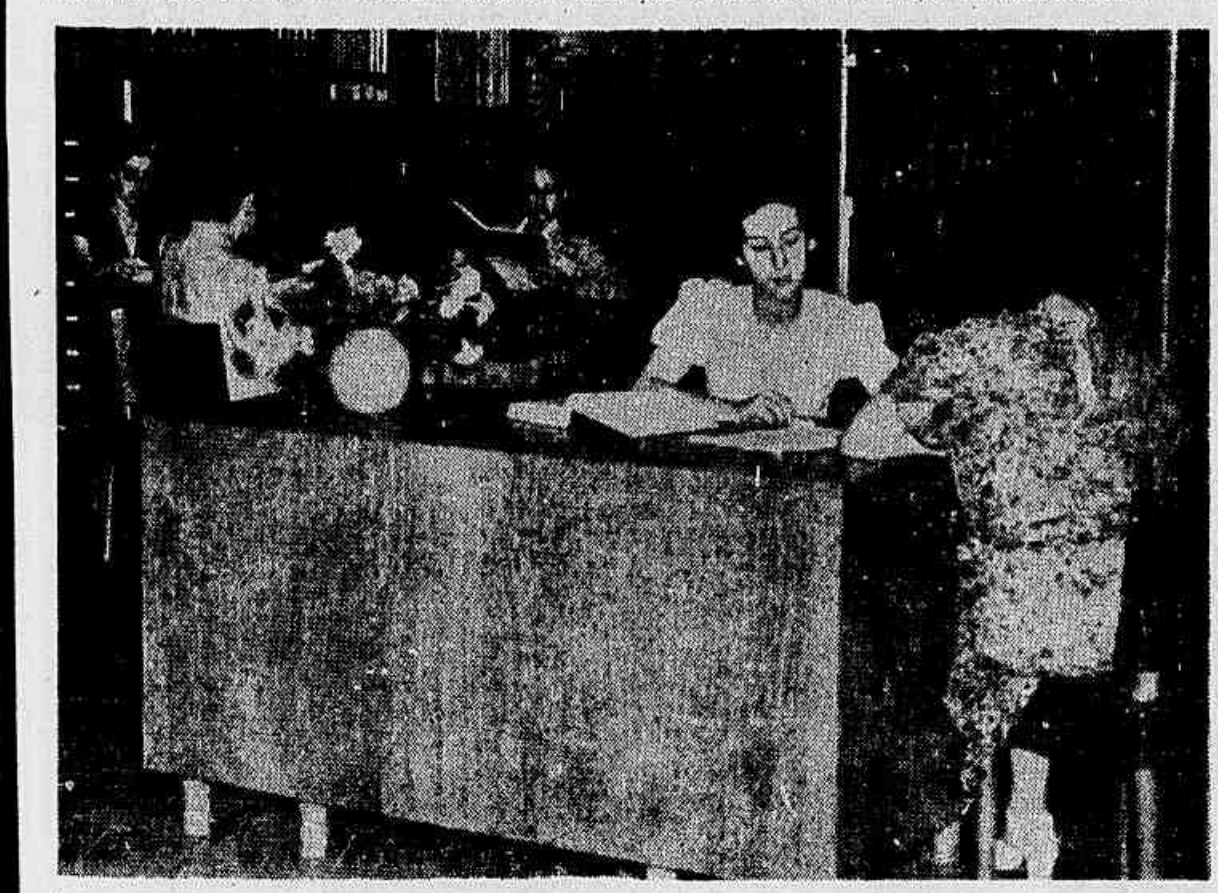
A "turma de referência" atende a uma leitora, indicando quais os livros para o concurso em que está interessada

A BIBLIOTECA no Brasil, neste último lustro, apresenta apreciado surto de progresso, graças ao nascimento de uma mentalidade biblioteconômica, proveniente da moderna política administrativa inaugurada pelo Departamento Administrativo do Serviço Público. Foram os cursos de biblioteconomia, instituídos pelo DASP, dentro dos mais recentes moldes da técnica biblioteconômica, e as aulas de estudos estrangeiros, com ênfase pelas principais bibliotecas, como a do Congresso em Washington, as causas do aparecimento, no Brasil, dessa mentalidade que veio permitir e tornar possível o surto que hoje se observa no terreno da biblioteconomia.