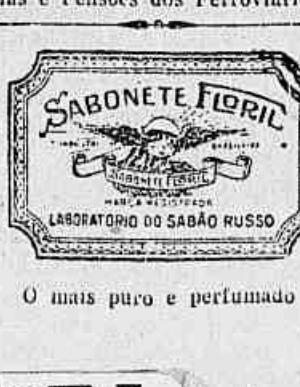
O mais puro e perfumado