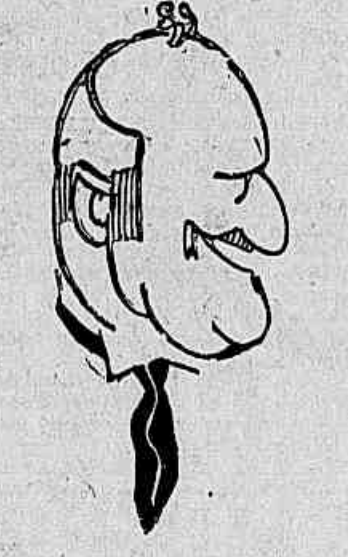
O "leader" Manoel Vilaboim, que, a despeito de todos os esforços, não conseguiu a maioria parlamentar para uma obra util e patriótica...

Quem se der ao trabalho de examinar a actividade do poder legislativo durante o corrente anno, ha de chegar a conclusões verdadeiramente amargas. O Congresso correu o risco de ser considerado durante o corrente anno, ha de chegar a conclusões verdadeiramente amargas. O Congresso correu o risco de ser considerado durante o corrente anno, ha de chegar a conclusões verdadeiramente amargas.