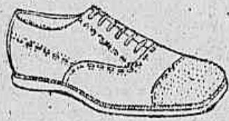
BLACK BOTTON Salto embutido, superior cramo preto na poller envernizada marron 263000