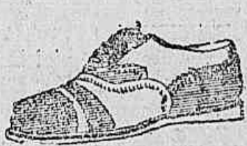
BLACK BOTTON Nossa criação, em superior cramo preto, com guarnição unico de couro com solado borracha de 36 a 44 263000 O mesmo calçado com sola de couro, de 36 a 44 223000