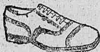
CREPE SOLLE Grande rebote, de 36 a 44 603000

Não comprem caro — Visitem as nossas exposições com preços marcados