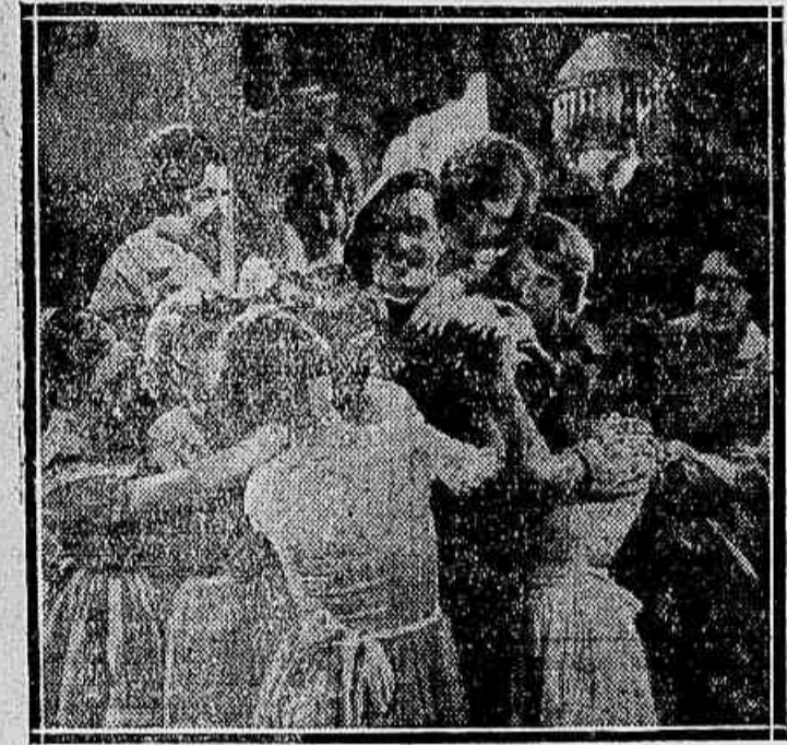
Norman Kerry — o galã vigoroso e bello de "Corpo e Alma", é disputado e querido das moças...

O FILM: "CASANOVA" CONTINUA A ENCANITAR O RIO DE JANEIRO