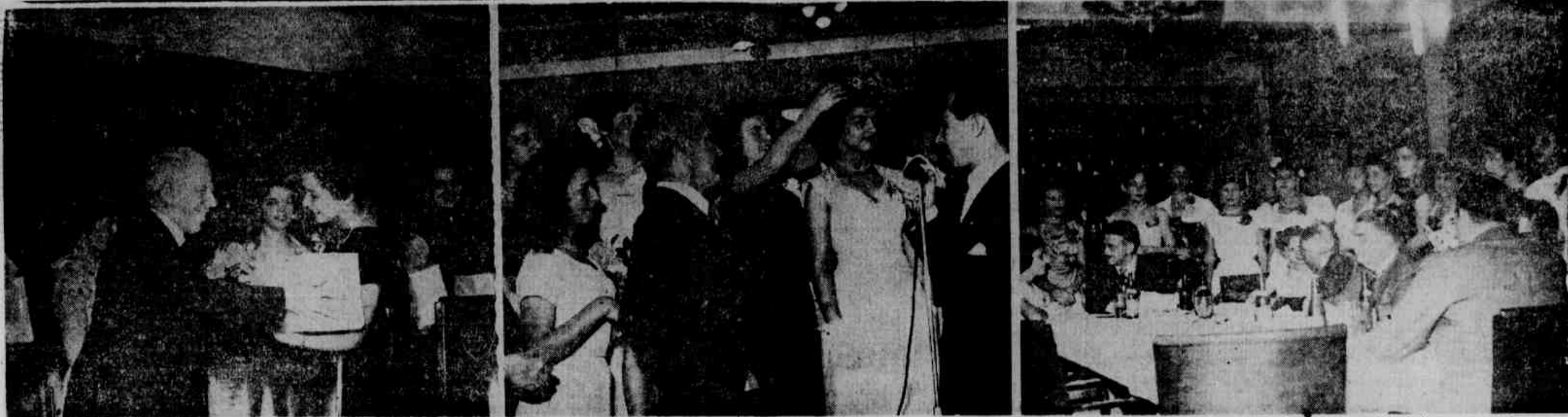
1 — Os momentos supremos da festa para a eleição da "Rainha da Primavera", estão traduzidos nos três flagrantes acima: à direita, quando eram selecionadas as candidatas; à esquerda, uma das princesas contempladas, e ao centro, a coroação da "Rainha da Primavera" de 1950.

A ABERTURA DOS II JOGOS DO SESI — Com as inscrições já encerradas, os II Jogos Desportivos do SESI têm a data de abertura fixada para o próximo dia 15 de outubro, na Quinta da Boa Vista. Com maior número de clubes inscritos do que no ano passado, os II Jogos Desportivos do SESI, que contam com oito modalidades de esportes diferentes, parece fadado a marcar retumbante sucesso no seio dos industriários, que aderiram aos esportes de corpo e alma.