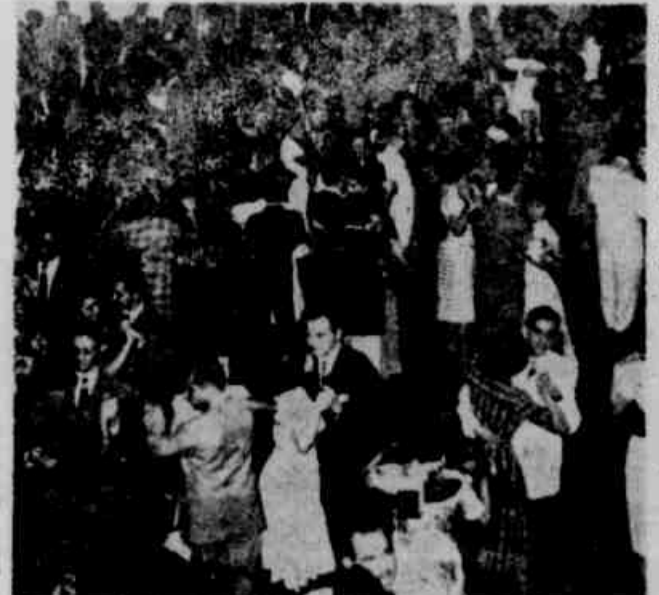
5 — Um aspecto dos salões do C. R. do Flamengo, durante reunião social serviu de pretexto para o conagração a festa para a eleição da "Rainha da Primavera" da classe industriária.