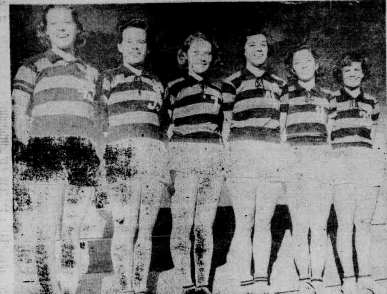
ESTREIA O CONJUNTO QUE É A SENSACÃO DO MOMENTO — Equipe jovem e verdadeiro orgulho dos rubro-negros, a turma de volleyball feminino do C. R. Flamengo, encontrará nos "Jogos da Primavera" magnífica oportunidade de mostrar, uma vez mais, a sua indiscutível eficiência, já que somente intervenção na sua "chave" autênticas expressões do desporto da rede como os seus co-irmãos, Fluminense e Tijuca, a Educação Física, o C. R. Icarai, de Niterói, o Pinheiros, de São Paulo, e o Friburguense, da cidade de Friburgo. E perante turmas de tanta projeção que o Flamengo irá disputar o título mais difícil da atual Olimpíada Feminina —