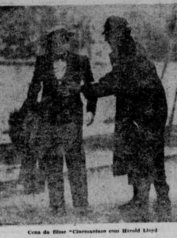
Cena do filme "Cinematoo com Harold Lloyd