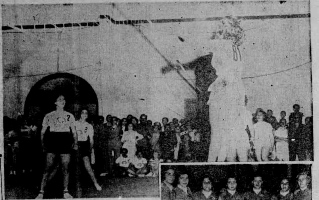
O Matutino De Maior Circulação No Distrito Federal Ano XX - Rio de Janeiro, quarta-feira, 27 de setembro de 1950

Em plena disputa dos "Jogos da Primavera", inauguraram-se, ontem, à tarde, e à noite, as competições relativas ao Volleyball. Nada menos de seis jogos movimentaram dezenas e dezenas de atletas enchendo, por outro lado, as dependências em que eles se desenvolveram, de um público tão numeroso quanto o das nossas melhores partidas oficiais do desporto da rede. A tarde, abriram-se os cotelhos do Grupo Colegial da Olimpíada Feminina de iniciativa de JORNAL DOS SPORTS. Lotou-se, Lotou-se, então, completamente o ginásio "caieira", não obstante o caráter de simples eliminatórias, das pejeas para ali programadas. Numa, o Colegio Rabelo obteve sua classificação, sem maior esforço. Na outra, a turma do Colegio Batista, embora novata, evidenciou bom preparo e melhor disposição. Comprou, na quadra, o louvável espirito desportivo. (Conclua na página 6)