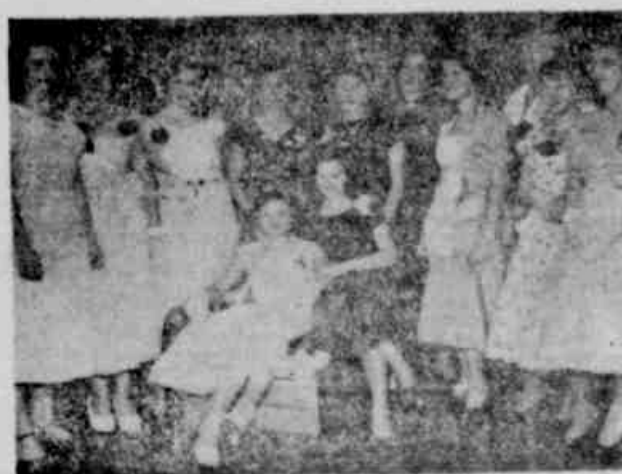
5 — Uma fotografia para o album de recordações de cada jovem, fixada pela objetiva. Alí estão a "Rainha da Primavera" de 1950 e sua corte de princesas. Um documento fotográfico de inesimável valor para todas as moças contempladas neste certame de graça e beleza.

Art. 10.º Deverão constar do programa dos II Jogos Desportivos do SESI, as seguintes modalidades desportivas: atletismo (masculino e feminino); basketball; box; ciclismo (máquinas de passeio e corrida); football; malha; natação (masculino e feminino); tennis de mesa (masculino e feminino); volleyball (masculino e feminino). § 1.º — Os desportos citados neste artigo, serão programados de acordo com o critério da Direção Geral, contarem com suficiente número de inscritos. § 2.º — Para inscrever-se em football a empresa deverá cumprir as seguintes exigências: a) — comparecer ao desfile, de acordo com o art. 13.º de Regulamento Geral; b) — Apresentar campo, dentro das exigências oficiais. Art. 11.º — Para estes jogos, as equipes, em cada modalidade desportiva, serão grupadas por sorteio, em uma ou mais chaves, obedecendo os jogos, ao processo de "eliminatórias simples" e regidos pelos próprios Regulamentos. Art. 12.º — A Direção Geral indicará o local, dia e hora, das competições, não cabendo às empresas o direito de se recusarem. (Continua amanhã)