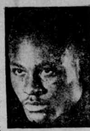
Ezzard Charles, o sucessor de Joe que defenderá o titulo contra o proprio Louis

Finalmente hoje, no grandioso Yankee Stadium, em Nova York, será realizada a sensacional pejea de box, em que o mais famoso e mais técnico de todos os campeões mundiais de peso pesado até hoje surgidos procurará realizar proeza impar na historia do pugilismo mundial, qual seja a de reconquistar o titulo depois de o haver abandonado. Joe Louis x Ezzard Charles é a luta que hoje à noite há de por certo galvanizar a atenção, não só das dezenas de milhares de "fans" que deverão estar lotando as dependências do grande estadio, como de todo o mundo desportivo, em todos os quadrantes do globo terrestre, onde Joe Louis continua pesando o grande prestigio que conseguiu como pugilista, por ter sido o mais técnico, o mais combativo e o mais leal de todos os Reis do ring. Ezzard Charles, por sua vez, achou-se no apogeu da forma fisica e técnica. (Conclua na página 6)