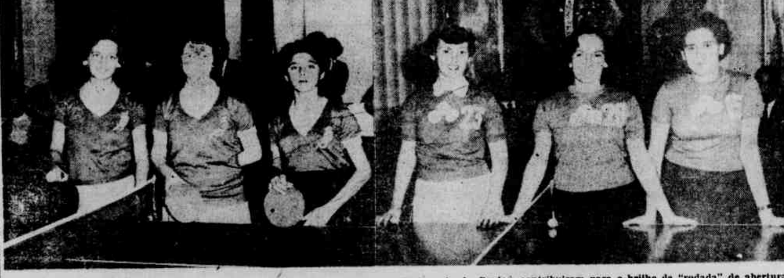
Estas equipes, responsáveis pela defesa das cores do Jacarepaguá Tennis Clube e A. A. Grajaú, contribuíram para o brilho da "rodada" de abertura do Torneio de Tennis de Mesa, dos "Jogos da Primavera". Hoje, outras turmas, não menos valorosas, emprestarão, igualmente, o seu concurso à nova etapa do certame

Entre Os Clubes, O Fluminense É O Segundo, Seguido Do Botafogo, Vasco E América — La Fayette, Anglo Americano E Carmela Dutra, Nas Posições Imediatas Do Setor Colegial — Computados, Até Agora, O Desfile E A Natação Já começou a definição de posições, em razão da apuração dos primeiros capítulos dos "Jogos da Primavera". Como competição propriamente dita, tivemos domingo, pela manhã, a natação. Quanto ao desfile, a participação representou cinco pontos para cada equipe, como estímulo e premio. Não houve vencedor a proclamar, em face da redução de todas as representações, para 15 atletas, dada a impossibilidade do desfile das mil e tantas jovens inscritas, no Tijuca, na memorável noite de 22. O C. R. Icarai, vice-campeão geral de 1949, é o lider, seguido do Fluminense, herói daquela brilhante jornada. (Conclua na página 7)