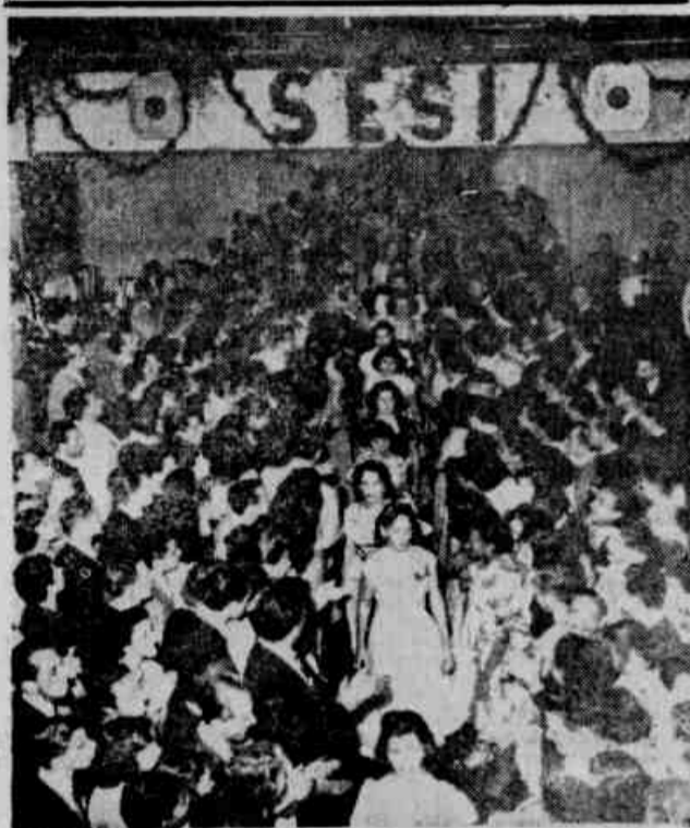
1 — As concorrentes ao título de a mais bela industriária de 1950, desfilam nos salões do C. R. do Flamengo.