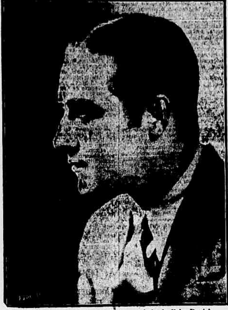
James Hall é o galã que apparece, ao lado do Bebe Daniels, em "Venus Mergulhadora"

Um novo e sensacional triumpho para Bobé Daniels