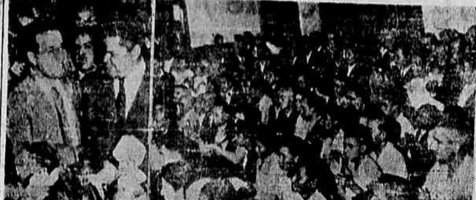
Em expressão solene, com a participação do Vice-presidente da República e numerosos outras autoridades e dirigentes sindicais, foi empossada, sábado último, a nova diretoria do Sindicato dos Trabalhadores em Construção Civil...