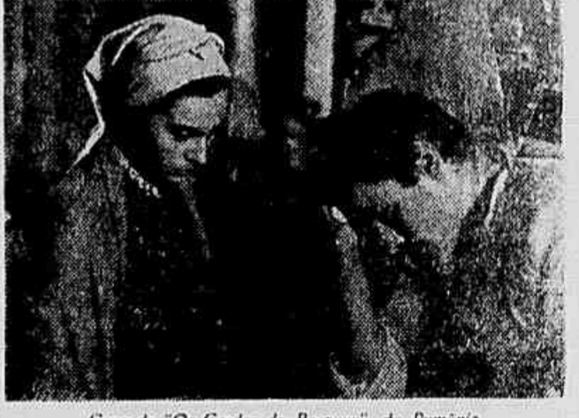
Cena de 'Os Cardos de Barangan', da Rómânia

rem a música, seu autor, Carlo Rustichelli.