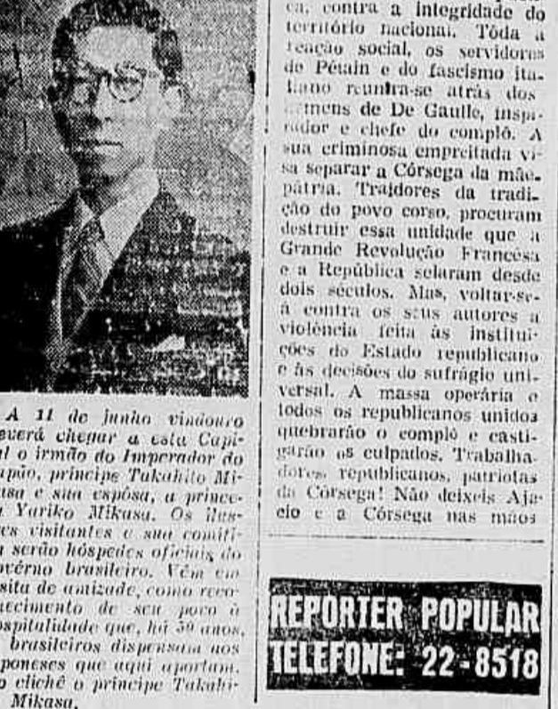
A 11 de Junho viajou de avião para o Brasil o irmão do Imperador do Japão, príncipe Takahito Mikasa e sua esposa...