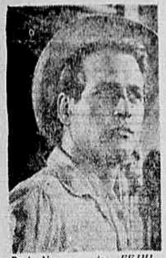
Paul Newman, dos BEBES, recebeu o prêmio de melhor interpretação masculina.

CANNES, maio (Via Panair do Brasil) — A última etapa do Festival está sendo vivida e os contactos comerciais e artísticos se multiplicam. Projeções diárias, extra-oficiais, são realizadas nos diversos cinemas da cidade. Fazem-se negócios, amizades, falase muito, emprenhem-se 5 ou 6 horas de projeção durante o dia.