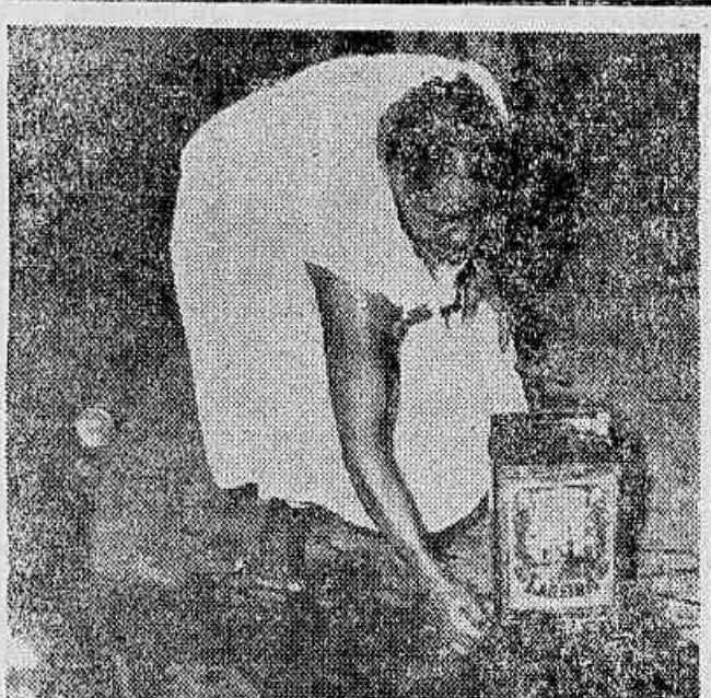
RACIONADA A ÁGUA NA ZONA NORTE — Em consequência de nova rutura na famosa adutora do Guandu, o abastecimento da Zona Norte foi prejudicado bastante nos últimos três dias. Até ontem, era nos hidrantes do "Corpo de Bombeiros" que os moradores da Rua 23 de Maio se abasteciam, conforme se pode ver pelo flagrante acima