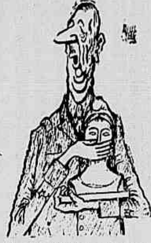
O general Charles De Gaulle tenta sufocar a República

ROMA, 26 (FP) — Terminaram hoje as operações de voto nas 55.000 seções eleitorais, às 14 horas. Foi iniciada a apuração logo depois do fechamento das mesas eleitorais. Foi considerável a afluência às urnas no segundo dia de eleições. Apesar de não terem sido publicados dados oficiais a respeito do número definitivo dos votantes (que ontem à noite, ao findar o primeiro dia das eleições, era de 77,1 dos inscritos), acredita-se que a percentagem média nacional tenha atingido a percentagem das precedentes eleições legislativas de 1953, ou sejam 93,8 por cento dos eleitores. Os dois dias eleitorais não foram assinalados por qualquer incidente notável, de lado alguns incidentes de caráter local. Por outro lado, a calma e a tranquilidade características dessa consulta popular jamais foram perturbadas por incidentes sérios no transcurso das nove semanas da campanha que precedeu as recentes eleições.