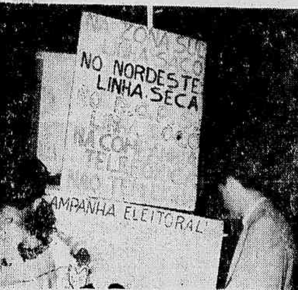
Encerrando o desfile, os rapazes e moças deixaram os seus cartazes nas escadarias do Teatro Municipal

COMO ocorre todos os anos, realizou-se ontem o "trote" dos calouros da Faculdade de Ciências Médicas cujo desfile percorreu o centro da cidade, encerrando-se no Teatro Municipal. (CONCLUI NA 2ª PAG.)