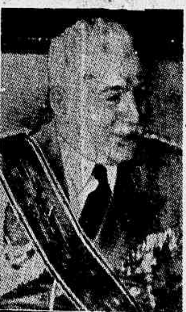
Von Neurath, o ex-protector

A TENSÃO DE ANIMOS NA BOÊMIA E NA UCRÂNIA — QUE É O NOVO "PROTECTOR" — ATENTADO CONTRA O "PREMIER" SLOVACO