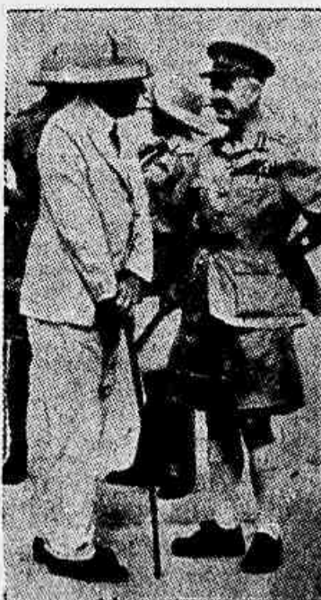
Wavell em palestra com um amigo Von Neurath

NOVA YORK, 29 (A. P.) — A emissora Rádio de Berlim irradiou despatches da "DNB" de Praga informando que foram executados dois antilobos generais tchecos, dois civis da capital e mais dois de Bruenn. Apresentaram os despatches que os dois generais tinham sido réus de "alta traição" e os outros haviam sido condenados por "porte de armas proibidas e atos de sabotagem".