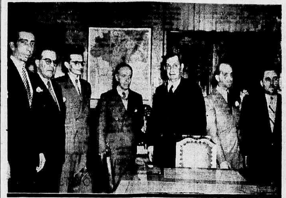
Aspecto da visita do general Góes Monteiro à Secção de Segurança Nacional do Ministério da Viação