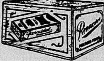
Caixa original com 3 vidros de vidros

ROLINK & CIA. ACEITAM-SE REPRESENTANTES NOS ESTADOS E NO ESTRANGEIRO