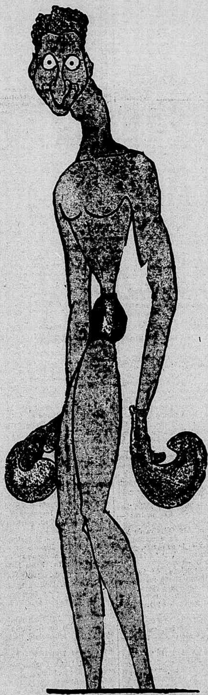
CAMPOLO, tal como um cari caricatura argentino viu o gigante