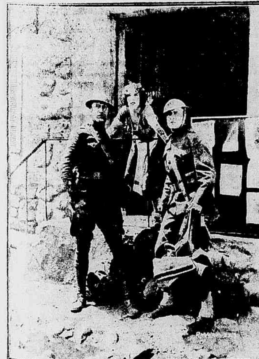
Uma scena de "Sangue por Gloria", apresentada por William Fox