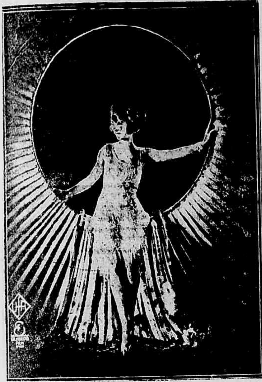
LILIAN HARVEY, a formosa "Casta Suzanna", da UFA

As victorias da Ufa seguem-se -- Amanhã, mais uma formidável obra encenada pela grande marca alemã irá para o cartaz do Lyrico, como o programma mais arrebatador da semana que começa