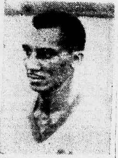
Ele que participou do individual do Vasco