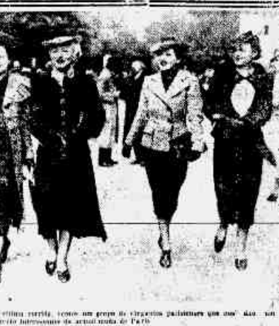
Um grupo de mulheres em elegantes vestidos.