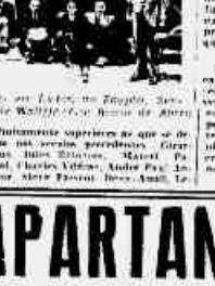
A bordo do "Champollion" por ocasião da partida para o Egipto. De cima para baixo: Boissy, o poeta, o jornalista, o poeta, o jornalista...