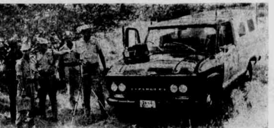
• O RADAR DA POLÍCIA RODOVIÁRIA, EM PLENO FUNCIONAMENTO JÁ PEGOU MUITA GENTE