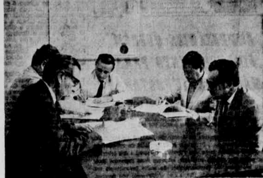
Superintendente da Fronteira Sudeste destina, ontem, 13 milhões de cruzeiros para a construção de duas pontes e três pontilhões, em Jaguar. As pontes serão construídas sobre o rio Estrela e a ponte Esperança-Curupí, e sobre o rio São João.