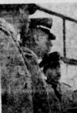
Um grupo de oficiais superiores da Brigada Militar esteve presente no Aeroporio Salgado Filho, por ocasião do embarque do governador eleito...