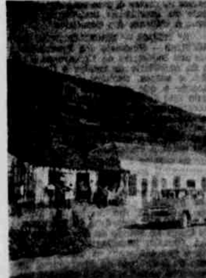
Não obstante a Polícia Rodoviária haver advertido para advertir os motoristas, vários outros que se encontravam estacionados nas proximidades de um alambique (à esquerda). A multa poderá vir em qualquer momento, caso seja constatado que o veículo não possui a licença necessária para ser utilizado em atividades comerciais.