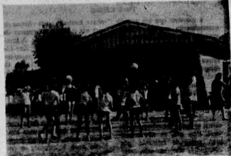
Alguns das sessões recreativas que passam parte de suas férias na Colônia de Recuperação de Trabalhadores...