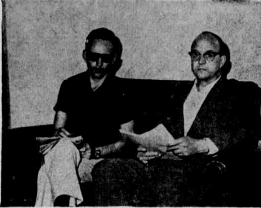
A foto mostra o encontro do diretor do Colégio Industrial, recentemente criado na Universidade Federal de Santa Maria, quando disse de sua satisfação em ver criado o Colégio Industrial que veio trazer mais benefícios aos alunos...