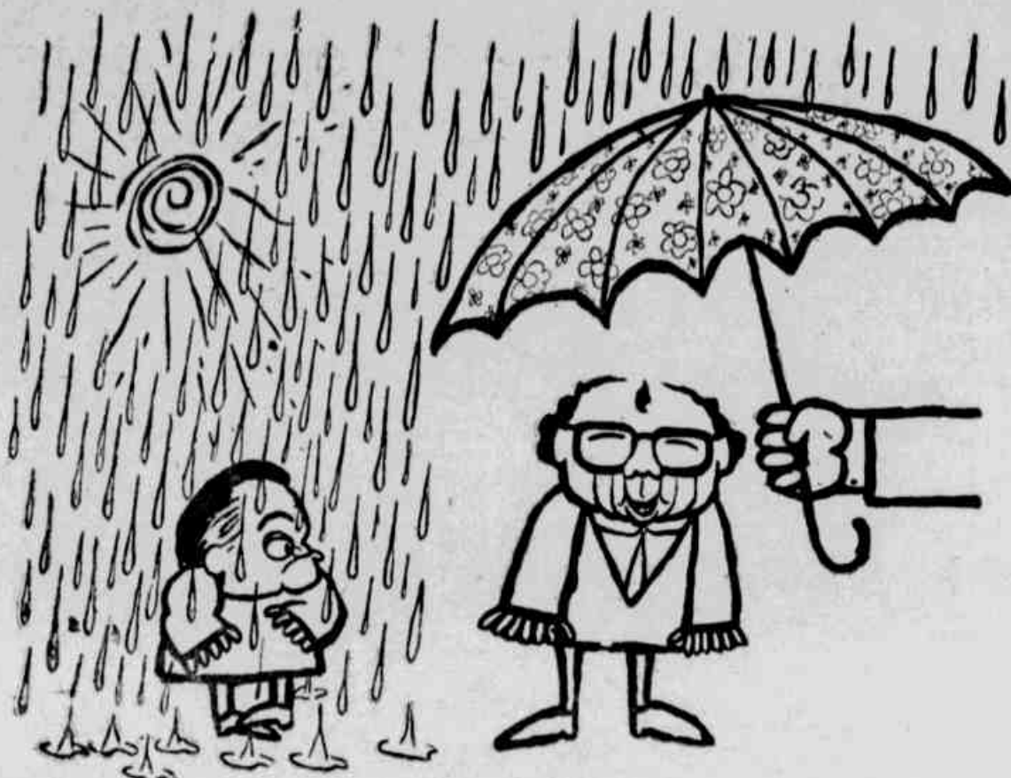
Chuva de verão