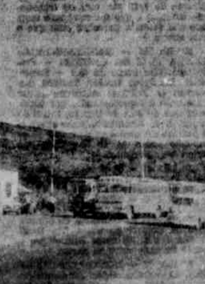
para advertir os motoristas, vários outros que se encontravam estacionados nas proximidades de um alambique (à esquerda). A multa poderá vir em qualquer momento, caso seja constatado que o veículo não possui a licença necessária para ser utilizado em atividades comerciais.