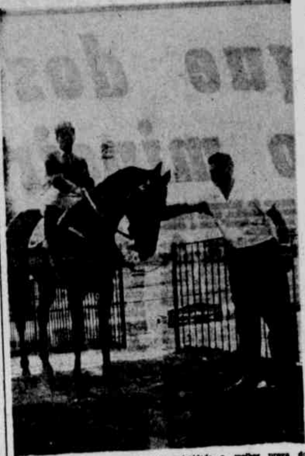
Mandellin ganhou com excelente autoridade a melhor prova do programa de sábado