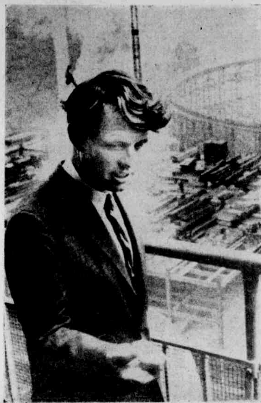
Todos os candidatos parecem ler o senador Robert Kennedy e brotina correção ditada, inclusive ele, que passa pelo serviço de imprensa da cidade de Nova York. Há rumores que cerca a publicação do ar na maior cidade do mundo, o que não deixa de ser assunto para um fotógrafo atento, nem para que um possível candidato à presidência dos Estados Unidos deve deixar de intercorrer. A crítica ao a Casa Branca costuma ter muitos degraus.