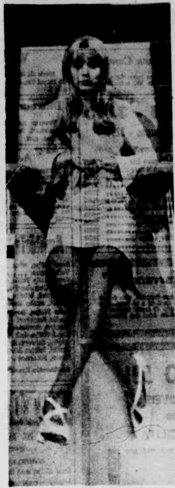
As farras da Brilé Eckart, retrato sem retoque do que é que se vê. O filme se chama 'Bofo' e o roteiro é de seu próprio marido, o inglês Peter Sellers, que como a foto está retratado não é nada mais que fala o nome da filha.