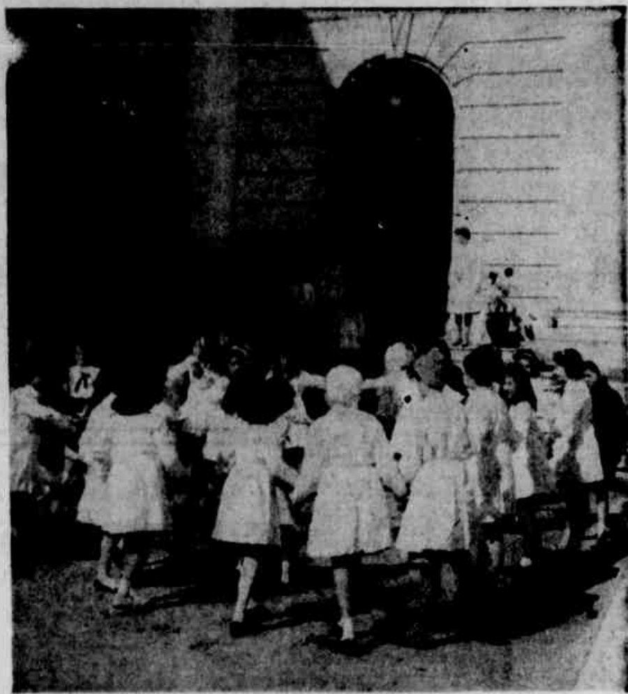
ALUNOS VOLTAM ÀS ESCOLAS

A propósito do projeto tramitado no Congresso Nacional, de autoria do deputado Floriano Peixoto, que dispõe sobre a criação de licença prêmio e que estabelece adicional de tempo de serviço para os empregados de indústria e comércio, a ACPA após ter estudado a matéria em conjunto com o Conselho Municipal