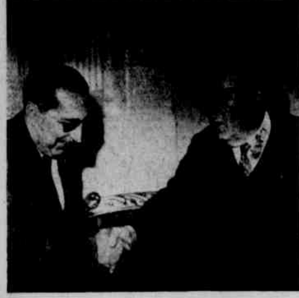
GENERAL COM O GOVERNADOR