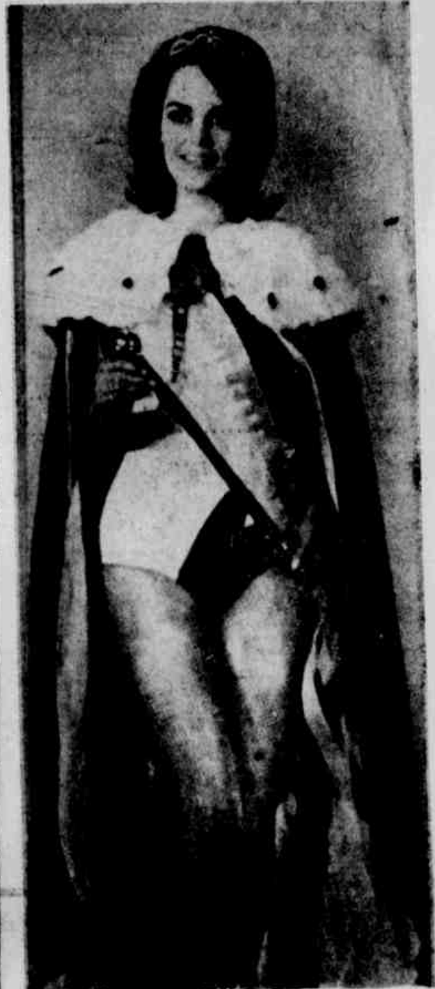
"MISS U - 64" É DA GRÉCIA