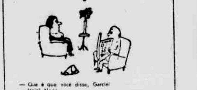
Que é que você disse, Garcia! Hoje! Nada.

Os empregados dirigem suas orações ao que está no meio. Os patrões têm mais fé nos dois que estão no lado.