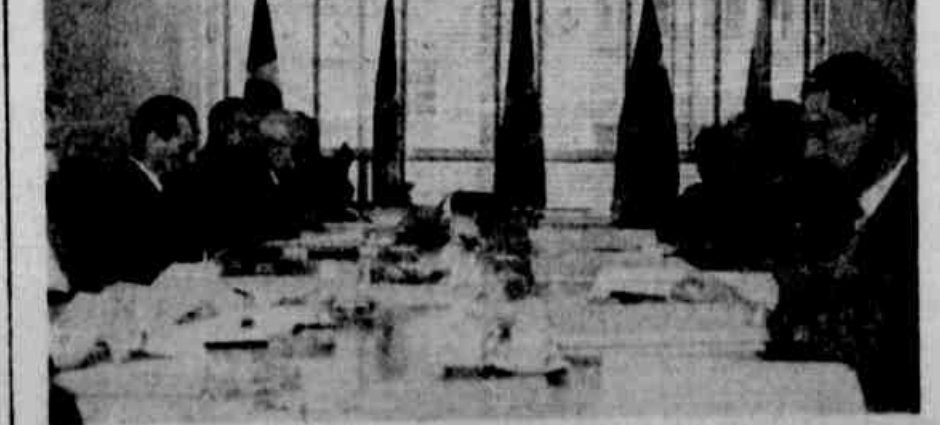
REUNIÃO ORDINÁRIA DO CONSELHO DELIBERATIVO