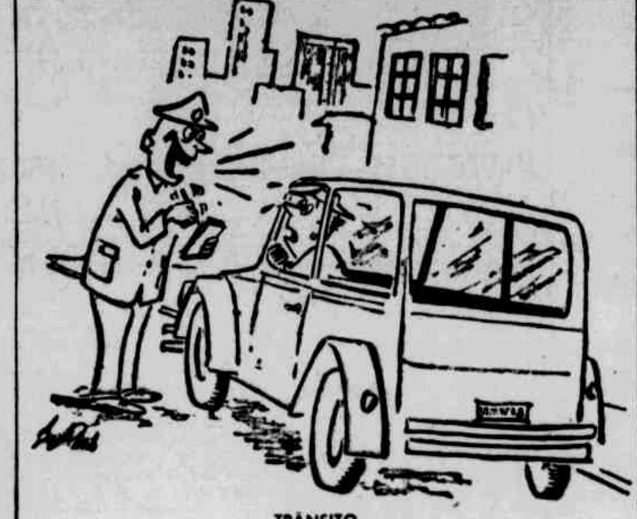
TRANSITO — Eu vi que o Sr. estacionou aí agora mesmo, mas já mudou tudo. E trate de escapar logo, antes que ponham um "trânsito proibido" lá na esquina!

PORTO ALEGRE, TERÇA-FEIRA, 4 DE AGOSTO DE 1964 — PÁGINA 18