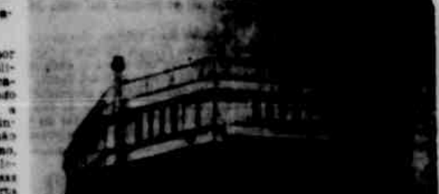
Este depósito do maior do velho "Gasômetro" com capacidade para cinco mil metros cúbicos ainda contém pequena quantidade de combustível a ser arreadado prontamente.