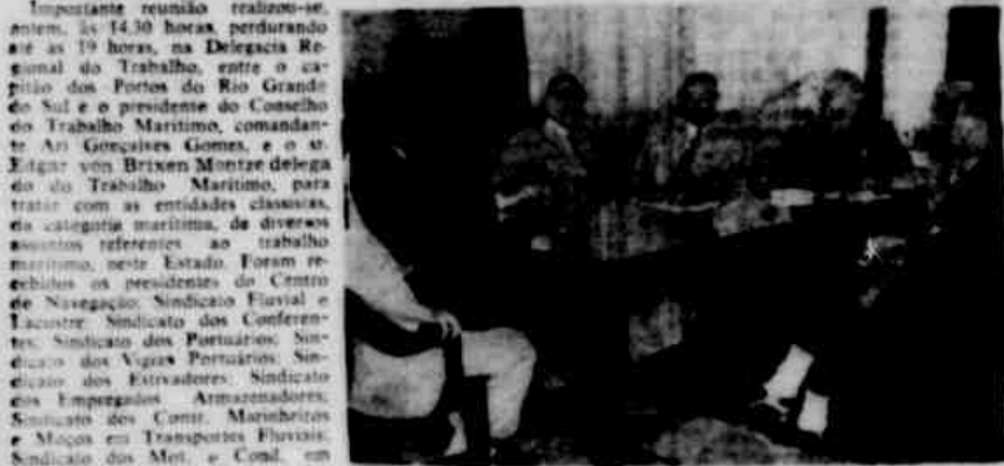
Aspecto da reunião de ontem do novo Delegado do Trabalho Marítimo e representantes da classe.