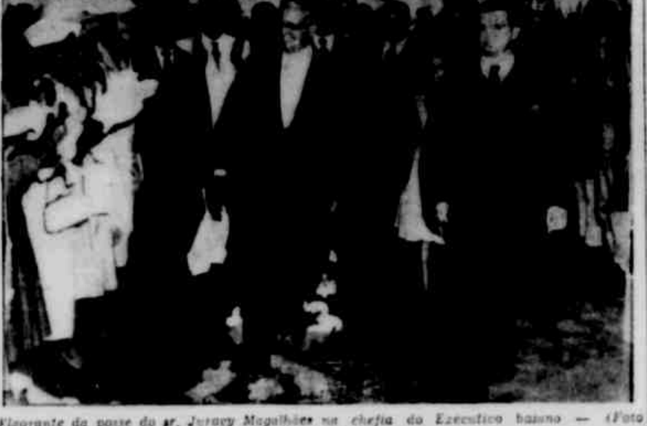
Flagrante da posse do sr. Juracy Magalhães na chefia do Executivo baiano —.