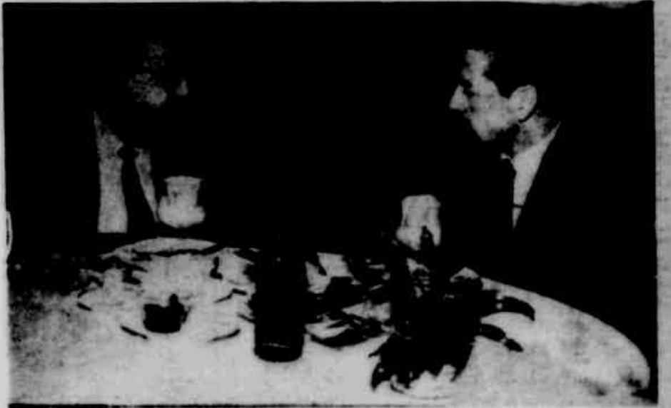
Poucas horas após sua chegada, o deputado San Thiago Dantas manteve um encontro com o chefe do Governo, durante um almoço íntimo, realizado no Restaurante Renner.

PONTOS FUNDAMENTAIS DA REFORMA Sobre o que considera os pontos fundamentais da reforma de base, assim definiu o prof. San Thiago Dantas: — Entendo como pontos fun-