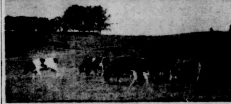
Realiza-se, hoje, no Posto Zootécnico de Montenegro, a concentração dos produtores de leite promovida pela Secretaria da Agricultura, como parte da Campanha do Aumento da Produtividade. A solução do problema leiteiro, através de um melhoramento das pastagens (foto), será um dos mais importantes aspectos a ser tratado naquela reunião, que constará com leituras de diferentes regiões do Estado.

— São as atividades econômicas, da economia privada, que, em seus empreendimentos, sentem desfalcações em meios financeiros, a partir da continuidade de produção, dentro dos mesmos níveis alcançados em anos anteriores, em que possuem lucros extraordinários; é o capital, portanto, que, pelo inevitável do preço dos bens que integram o processo produtivo, se mantém, sem mais palavras, inseguro quanto ao futuro de seus negócios. A o trabalho que, através de sua remuneração — o salário — se vê mal aquecido pela constante desvalorização do poder aquisitivo da moeda; isto, em fim, todos os agentes da produção, que nunca, em nosso país, foram acionados com tanta intensidade.