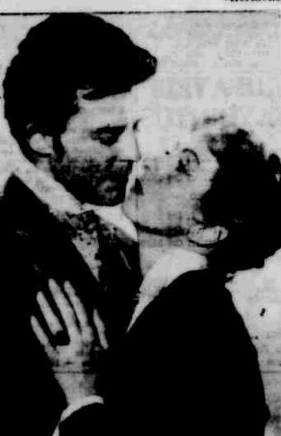
Gerard Philipe (na foto, com Danielle Darrieux) promete vir ao Brasil.

PARIS (via rádio) — Exaltado na sua Toulon com o filme "Les Enfants du Paradis", o ator francês Gerard Philipe, promete vir ao Brasil em uma longa estadia.