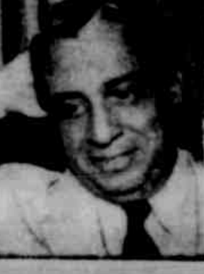
(Continua na pag. 13 Letra — 7)

RIO, 10 (Meridional) — O presidente da República assinou decreto ontem na pasta da Guerra, atribuindo ao Exército o povoamento inicial da rodovia Belém-Brasília no trecho compreendido entre as localidades de Guamã (Pará) e Gurupi (Goiás). Cabera a Superintendência do Plano de Valorização Econômica da Amazônia através do convênio com o Ministério da Guerra, o financiamento do plano, que deverá ser executado com a colaboração do Ministério da Aeronáutica, do Instituto Nacional de Imigração e Colonização, do Serviço de Proteção aos Índios e Colômbia, do Departamento Nacional de Estradas, do Departamento de Obras Públicas, do Departamento Nacional de Estradas, de outros órgãos julgados necessários, mediante solicitação do ministro da Guerra. Entre os objetivos que se destinam a ser alcançados encontram-se a necessidade de preservar a flora e a fauna amazônicas, proteção, assistência, das populações indígenas, segurança a manutenção do tráfego, assistência médica e saneamento e produção adequada aos núcleos a serem instalados, e sobretudo a criação de condições favoráveis ao povoamento daquela região.