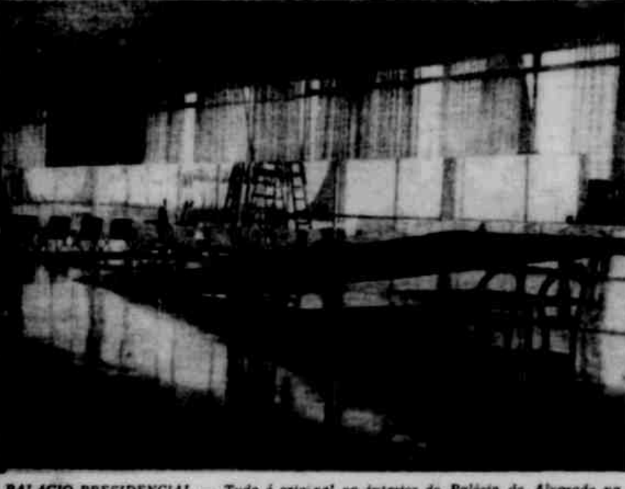
PALACIO PRESIDENCIAL — Tudo é original no interior do Palácio da Alvorada na nova capital do Brasil. Cristais aeromáticos, materiais plásticos e espelhos que produzem efeito tridimensional, salpêncem a revolucionária arquitetura desta cidade que nasce nas selvas.