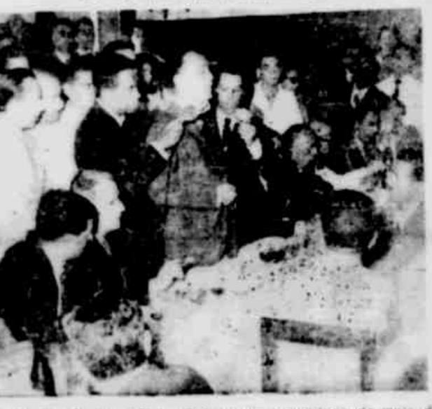
O banquete oferecido ao Presidente da República, contou com a presença de mais de cinquenta pessoas. A foto faz o instante em que o Presidente Juscelino Kubitschek discursava (de improviso), tendo a direita o Presidente do Conselho Nacional do Uruguai.

LIVRAMENTO, 17 (U.P.) — O governador de Santa Catarina, Flores da Cunha, saudando o Presidente Juscelino Kubitschek, afirmou que a população de Santa Catarina traz a vocação irrefreável de obediência à lei. O governador santanense fez a declaração durante o discurso pronunciado no município de Livramento, em companhia de seu filho, o Sr. Juscelino Kubitschek.