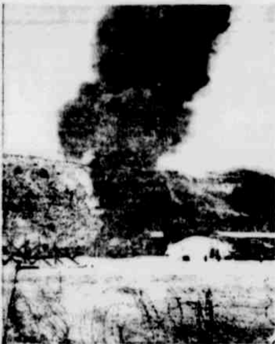
MANILHA, 18 (UPI) — O avião presidencial caiu sobre o monte Bagu, a 8.000 metros de altura, pouco depois de ter levantado voo de Cebu, onde o estadista filipino fizera voo de despedida.