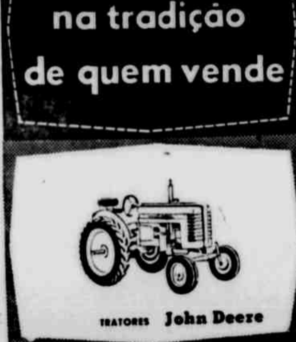
TRATORES John Deere

Confiança de quem compra na tradição de quem vende