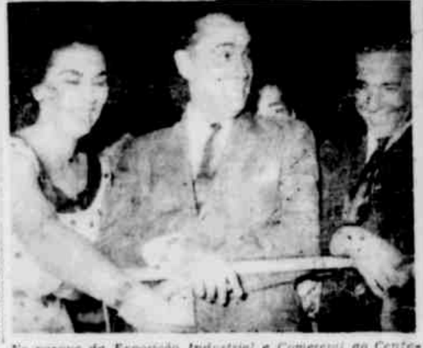
No parque da Exposição Industrial e Comercial ao Centenário de Livramento, Maria José, Juscelino e Jango recebem os aplausos da população.

outros lugares de diversão. As bandeiras ondulam a meia-pau e as estações de rádio somente transmitem música serena. Anteriormente, o vice-presidente e ministro das Relações Exteriores Carlos P. Garcia, regressou novamente da Austrália para prestar juramento nessa cerimônia singular diante do presidente da Suprema Corte, Ricardo Paras. Imediatamente depois convocou o gabinete e anunciou que a nação renderia todas as homenagens possíveis ao mandatário falecido.