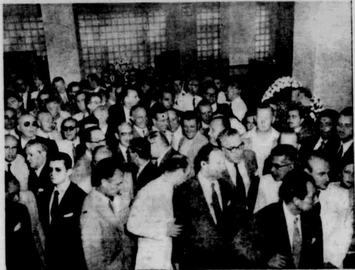
Quase duas centenas de pessoas, entre autoridades, membros do comércio e da indústria e convidados especiais compareceram à solenidade de inauguração da nova filial do Banco da Lavoura de Minas Gerais, S. A. Todos foram unânimes nos elogios a política bancária seguida pelo estabelecimento que assidua em nosso Estado um vasto programa de expansão. As novas instalações, amplas e confortáveis, permitem ao Banco da Lavoura mais ainda, atender com presteza a todos que procuram no estabelecimento, a tradicional urbanidade e segurança com que são atendidos as suas operações.