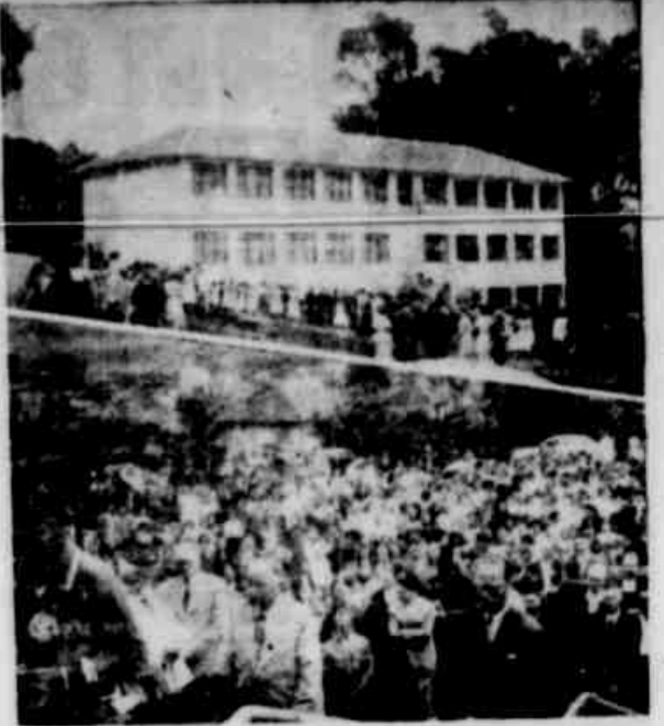
Ao alto, vista do novo Ginásio de São Marcos; embaixo, flagrante das solenidades da inauguração.

fosse a inauguração, que recebeu a bênção do Reverendíssimo Bispo de Caxias do Sul e do Ginásio São Marcos, com a presença do governador do Estado, dos prefeitos de Caxias do Sul e Flores da Cunha, moradores. Embora ainda não