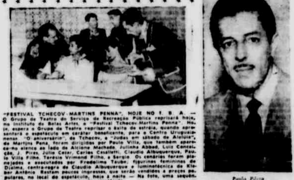
FESTIVAL TCHECOV MARTINS PENNA. HOJE NO 1.º E 2.º - O Grupo de Teatro do Serviço de Recreação Pública...