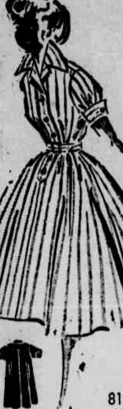
A grande novidade são os vestidos de algodão que parecem lã. Este vestido juvenil deve conquistar-lhe a simpatia.