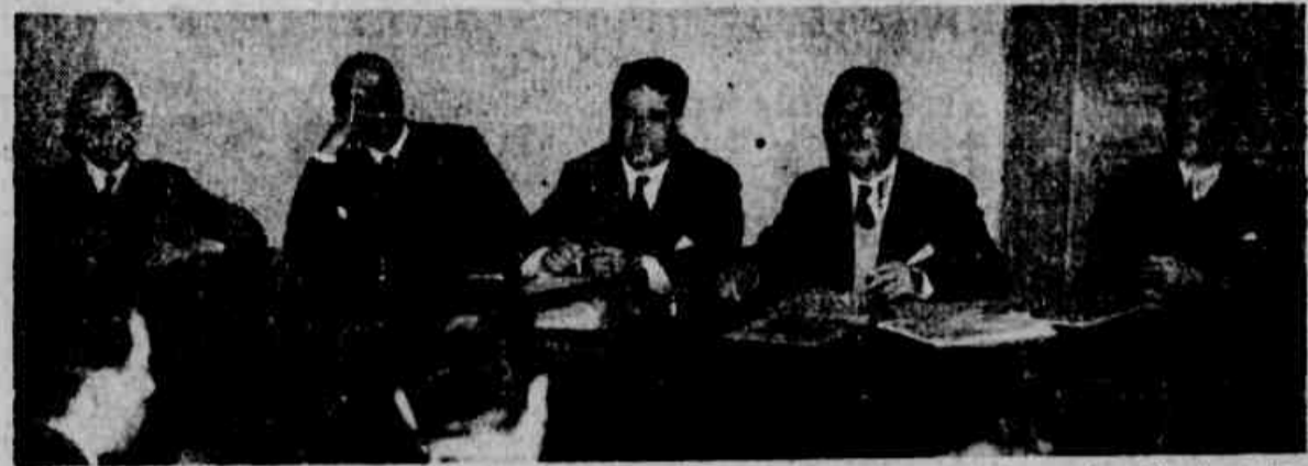
Em sessão que poderá ser decisiva para os destinos do PSD rio-grandense, reuniu-se, ontem, extraordinariamente, o Diretório Regional pessedista...