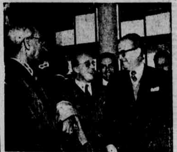
Flagrante colhido na ocasião do desembarque, ontem, no Aeroporto, do ministro Delfim Moreira Junior, presidente do Tribunal Superior do Trabalho

ANO XXI — PORTO ALEGRE, SABADO, 16 DE JULHO DE 1955 — PAGINA 13