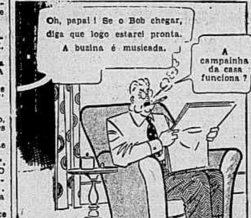
Oh, papai! Se o Bob chegar, diga que logo estarei pronta. A buzina é musicada.