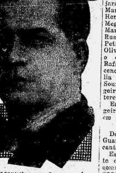
Commendador Arthur de Castro

O interventor no Distrito Federal assignou um decreto