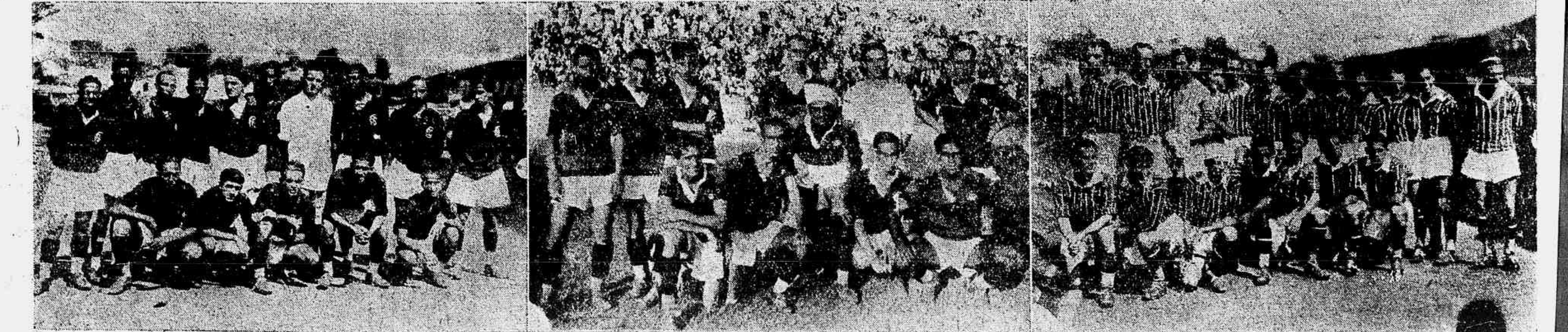
Os quadros do America, do Flamengo e do Fluminense, que lutaram, hontem, com grande enthusiasmo pelo triumpho que, entretanto, coube á valorosa turma vascaina, que se sagrou campeã pela quarta vez.

As eliminatórias de natação, realizadas, hontem, no Fluminense F. C., não corresponderam á expectativa