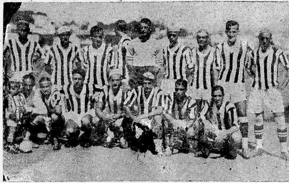
As aguerridas turmas do Botafogo F. C. (vice-campeã) e do C. R. Vasco da Gama (campeã). — Os vascainhos terrivel team botafoguense

O torneio inaugural foi vencido pelo Vasco, tendo o Botafogo se collocado em 2.º lugar