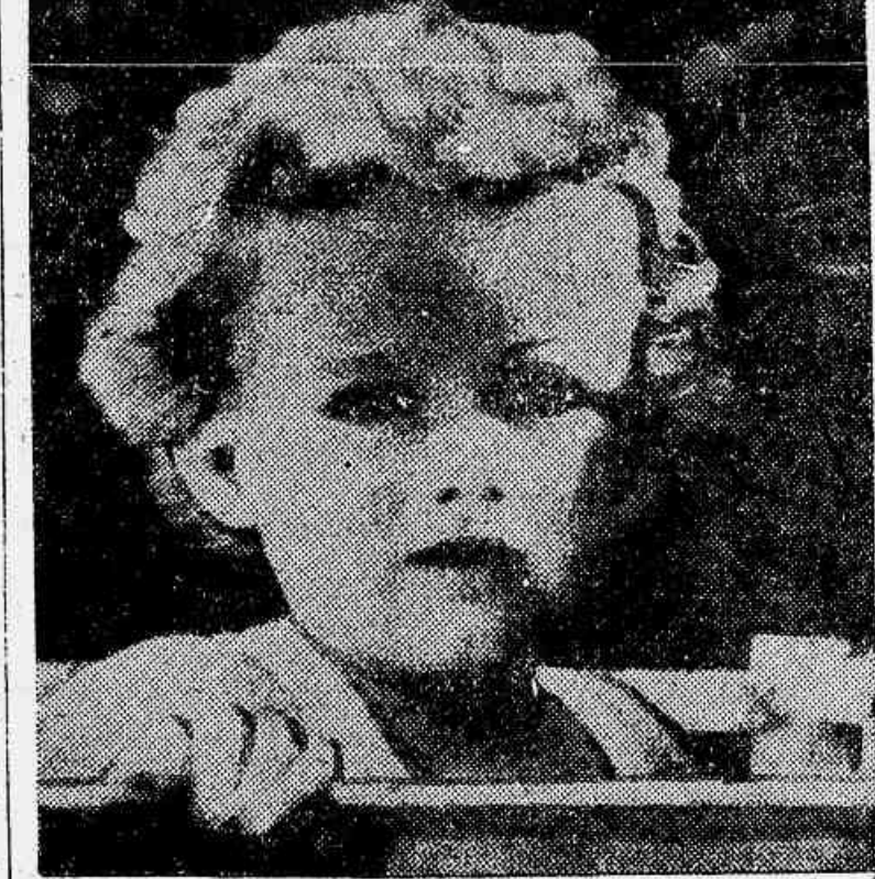
O menino Charles Lindbergh

O grande aviador teria levantado vôo, hontem, para Cape Cod