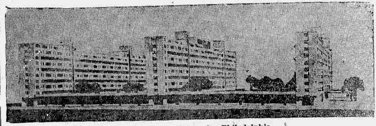
Plano das casas-modelos de Philadelphia